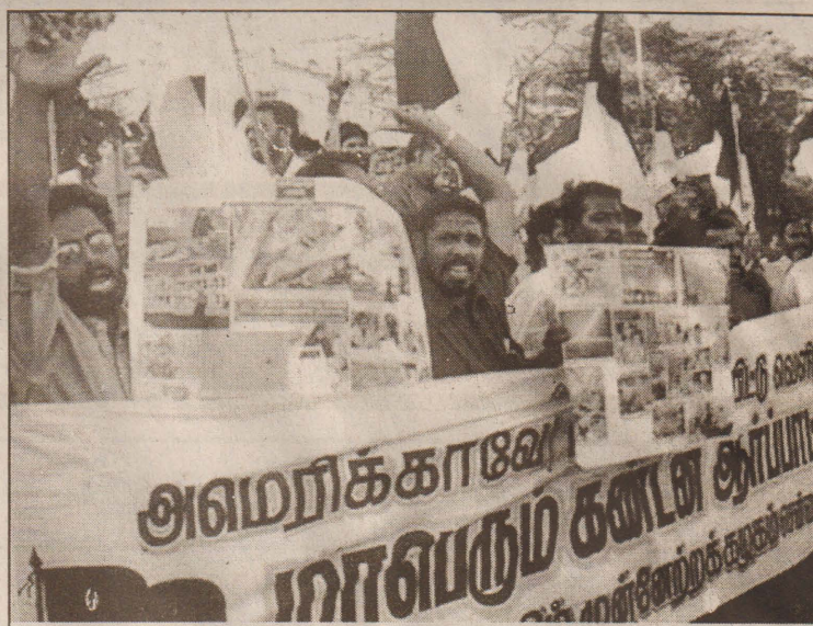
ஈராக்கை விட்டு அமெரிக்கப் படைகளை வெளியேறக் கோரி சென்னை அரசு பொது மருத்துவமனை எதிரே உள்ள மெமோரியல் ஹோல் அருகே தமிழ்நாடு முஸ்லிம் முன்னேற்றக் கழகத்தினர் கண்டன ஆர்ப்பாட்டம் நடத்தினர்.

ஈரானின் புனர்நிர்மாணப் பணிகள் குறித்து இந்திய வெளிவிவகாரத்துறை ஒருங்கிணைந்து செயற்படும் எனவும் அத்வானி மேலும் கூறியுள்ளார். (த-9)