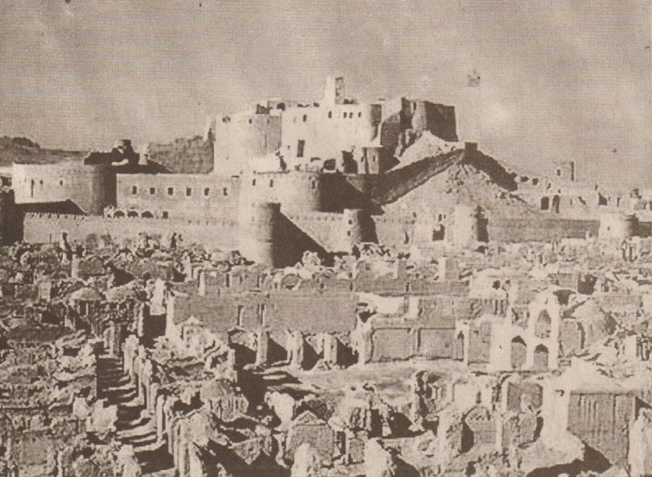
பதினாறாம் நூற்றாண்டைச் சேர்ந்த ஈரானின் பழமையான நகரம் என்ற வரலாற்றுப் பெருமை கொண்டிருந்த பாம் நகரம், நில நடுக்கத்தால் சுவடு தெரியாமல் தரைமட்டமாகி விட்டது. நில நடுக்கம் ஏற்படுவதற்கு முன்பு அந்த நகரின் அழகிய தோற்றம்.

அமெரிக்காவின் கால்நடை பொருளாதாரத்தில் வீழ்ச்சி ஏற்படுத்தும் முகமாக திட்டமிட்டுச் செய்யப்பட்ட சதிமுயற்சி இது என்றும் அமெரிக்கா குற்றம் சாட்டியுள்ளது. கால்நடை உற்பத்தியின் ஏற்றுமதி பாதிப்படைந்தமையினால் அமெரிக்கா நாளொன்றிற்கு 27 பில்லியன் அமெரிக்க டொலர்களை இழக்க நேரிட்டுள்ளமையும் இங்கு குறிப்பிடத்தக்கது. (த-9)