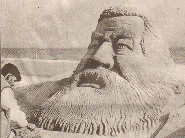
ஹிலா மாநிலம் பூரி கடற்கரைப் பகுதியில் மணலால் உருவாக்கப்பட்ட ஈரானின் அதிபர் சதாம் ஹுஸைனின் உருவத்திற்கு இறுதி வடிவம் கொடுக்கும் கலைஞர்.

தமது ரிபந்தனைகளை ஏற்க இந்தியா தயாராக இருந்தால் பேச்சுவார்த்தை நடத்தத் தாம் தயாராக இருப்பதாக "உல்பா" அமைப்பு கூறியிருக்கிறது.