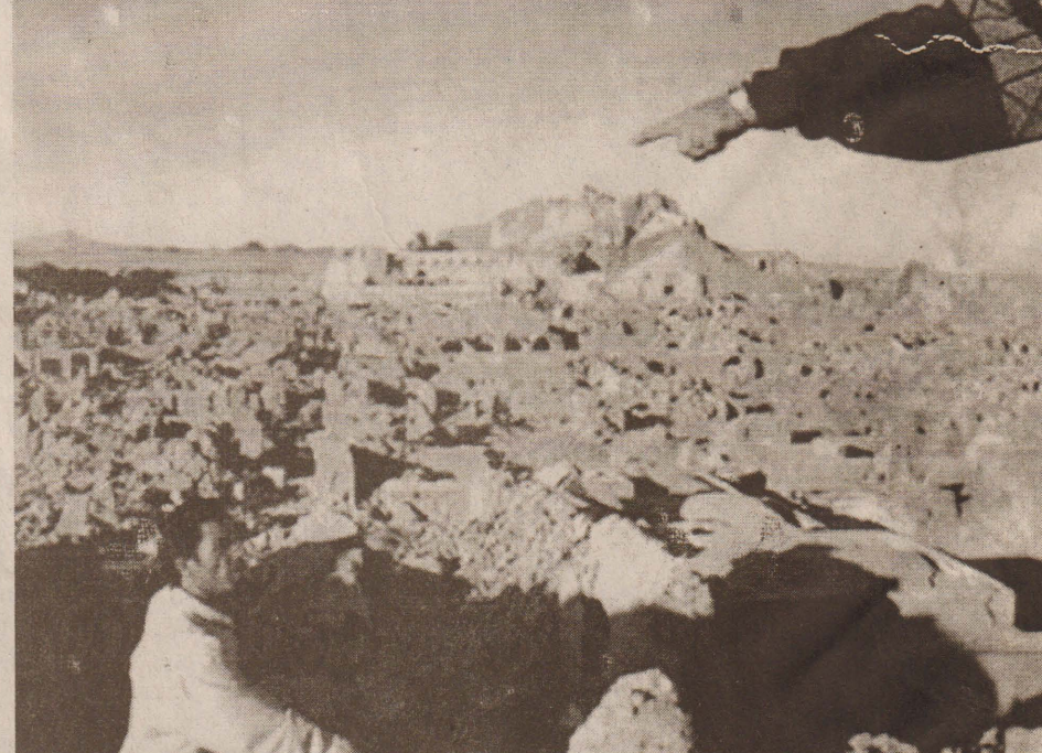
தற்போது சுவடு தெரியாமல் தரைமட்டமாகிக் காணப்படும் ஈரானின் பாம் நகரத்தின் தோற்றம்.