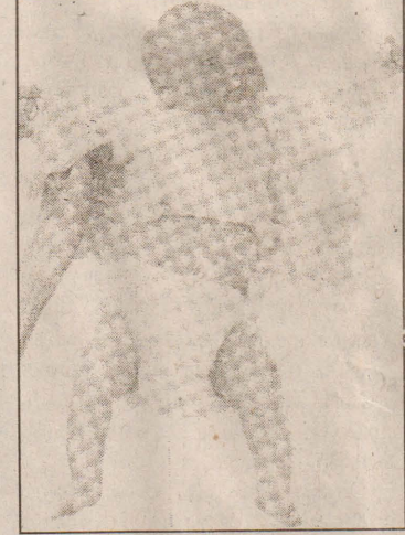
சத்து குறைவும் ஏற்படுகின்றது.

குறைத்தோ அல்லது நிறுத்தியோ விடுகின்றனர். இதனால் ஊட்டச்