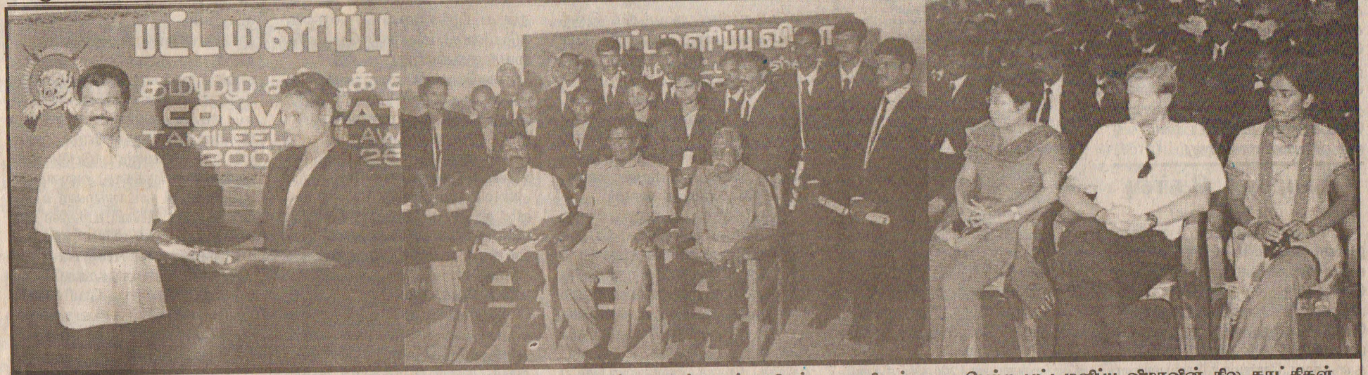
தமிழ் சட்டக் கல்லூரியில் பயின்று பயிற்சியை முடித்துக் கொண்ட சட்டவாளர்களுக்கு நேற்றைய தினம் நடைபெற்ற மாட்டமளிப்பு விழாவின் சில காட்சிகள்

சங்கு 05 வள்ளுவர் ஆண்டு 2035 தை 12 திங்கட்கிழமை (26-01-2004) தொலைபேசி - 2223378 ஒலி 38