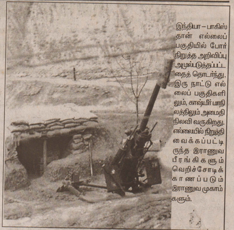
இந்தியா-பாகிஸ்தான் எல்லைப் பகுதியில் போர் நிறுத்த அறிவிப்பு அமுல்படுத்தப்பட்டதைத் தொடர்ந்து, இரு நாட்டு எல்லைப் பகுதிகளிலும், காஷ்மீர் மாநிலத்திலும் அமைதி நிலவி வருகிறது. எல்லைப் பகுதி வைக்கப்பட்டிருந்த இராணுவ பீரங்கிகளும் வெறிச்சோடிக் காணப்படும் இராணுவ முகாம்களும்.

அவ்வாறு ஒரு நியமனம் ஏற்பட்டால், ஐரோப்பியப் பேரரசு யூரோப்பியன் ஸூப்பர்ஷேட் ஒன்றை அமைப்பதற்கு அது ஒப்பாகிவரும் என்றும் பிரித்தானியா காரணம் கூறியிருக்கின்றது. (தி-9)