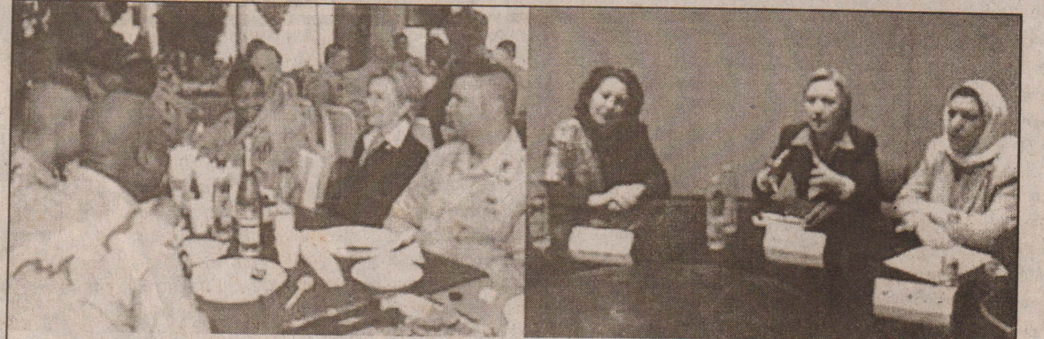
ஈராக் தலைநகர் பக்தாத்தில் அமெரிக்க இராணுவ வீரர்களுக்கு கடந்த வெள்ளிக்கிழமை நன்றி கூறும் நிகழ்ச்சியில் யு.எஸ். முன்னாள் அதிபர் கிளிண்டனின் மனைவி ஹிலாரி (வலது) மகளிர் அமைப்பின் முக்கிய தலைவர்களுடன் ஆலோசனை.