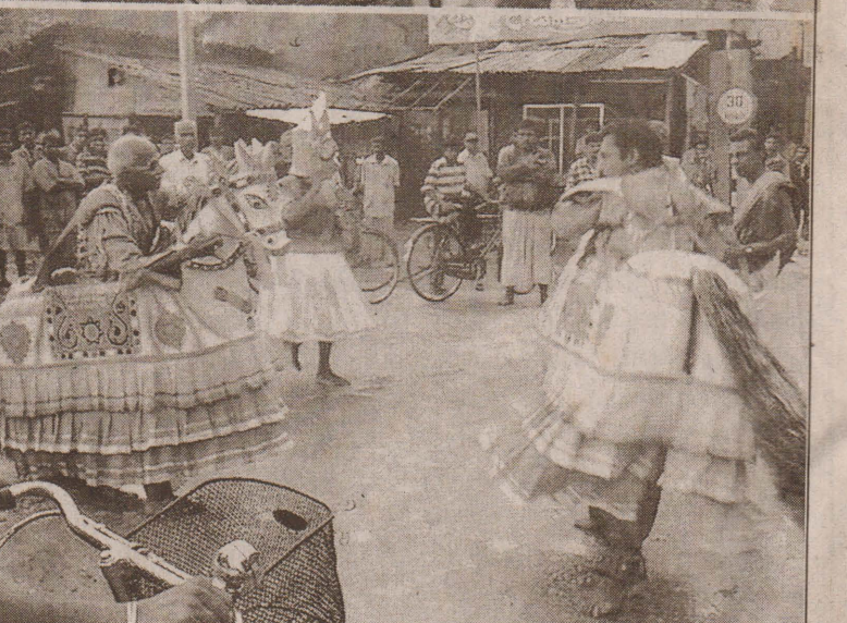
கொமர்ஷல் வங்கியின் அனுசரணையுடன் யாழ். கலாசார உத்தியோகத்தர் கலையகம் நடத்தும் மாவட்ட வருடாந்தக் கலா சார விழாவின் முதலாம் நாள் நகழ்வீன்போது வண்ண வைத்தீஸ் வரன் ஆலய முன்றலில் இருந்து ஆரம்பமான பண்பாட்டுப் பேரணி.