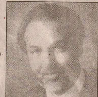
களைந்து, மீண்டும் சமாதானப் பேச்சுவார்த்தையினை ஆரம்பிப்பதற்கு தேவையான அழுத்தத்தை இந்திய அரசு வழங்குமா இருந்தால், எமது கோரிக்கைகள் குறித்து மீண்டும் விடுதலைப்புலிகளுடன் பேசி ஓர் இணக்கப்பாட்டிற்கு வர முடியும் என்ற நம்பிக்கை எமக்கிருக்கிறது. இதேவேளை, எமது தனித்தரப்பு கோரிக்கையை பிரதமர் ரணில் விக்கிரம சிங்கவோ அன்றி ஜனாதிபதி சந்திரிகா குமாரதுங்கவோ நிராகரிக்கவில்லை. எனவே, தமிழீழ விடுதலைப்புலிகள் தமது அலட்சியப் போக்கில் இருந்து விலகி எமது கோரிக்கைகளை ஏற்று மீண்டும் சமாதானப் பேச்சுவார்த்தையை ஆரம்பிக்க முன்வரவேண்டும் என்றார். (தி-62,10)