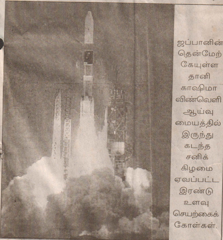
ஐப்பானின் தென்மேற்கேயுள்ள தானி காஷிமா விண்வெளி ஆய்வு மையத்தில் இருந்து கடந்த சனிக்கிழமை ஏவப்பட்ட இரண்டு உளவு செயற்கைக் கோள்கள்.

துருக்கியின் எல்லைப் பகுதியூடாக ஈரானுக்குள் தப்பிச் செல்ல முயன்றபோதே இவர்கைது செய்யப்பட்டதாகத் துருக்கியப் பொலிஸ் பிரதம அதிகாரி ஒருவர் தெரிவித்துள்ளார். (தி-9)