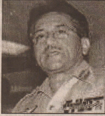
பிடித்து வருகின்றமை இங்கு குறிப்பிடத்தக்கது. (தி-2)

இதேவேளை, கடந்த செவ்வாய்க்கிழமை நள்ளிரவு முதல் காஷ்மீர் எல்லைப் பிரதேசத்தில் இரு நாடுகளும் யுத்தநிறுத்தத்தைக் கடைபி