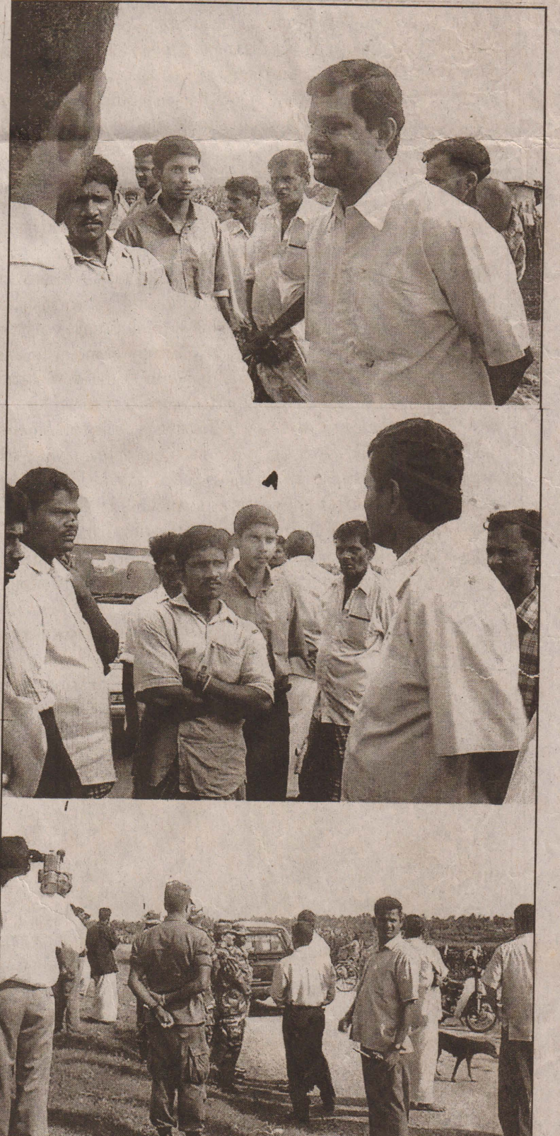
நாவாந்துறை வசந்தபுரப் பகுதியில் 51வது படையணிப் பிரிவினர் ஒன்றரைக் கிலோமீற்றர் நிலப்பகுதியை கிந்து கலாசார விவகார அமைச்சர் தி.மகேஸ்வரனிடம் நேற்றுக் கையளித்த போது எடுக்கப்பட்ட படங்கள்.

இதுபோலவே அடுத்தகட்டமாக குருநகர்ப் பகுதியில் 5 மாடிக் கட்டடம் உட்பட மக்கள் மீளக்குடியேறுவதற்கு ஏற்ற பகுதிகளை படையினரிடம் இருந்து விடுவித்து, அப்பகுதிகளில் மக்கள் மீளக்குடியேறும் வகையில் உரிய நடவடிக்கைகளை தாம் மேற்கொள்வதாகக் குறிப்பிட்டுள்ளார். (தி-16,43)