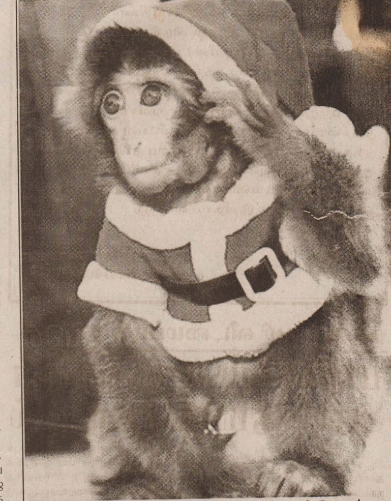
சீன ஜோதிட நாட்காட்டியின் படி 2004ஆம் ஆண்டு குரங்குகள் ஆண்டாக கடைப்பிடிக்கப்படவுள்ளது. இந்நிலையில் ஜப்பான் தலைநகர் டோக்கியோவில் உள்ள பொழுதுபோக்கு பூங்கா ஒன்றில், சாண்டா கிளாஸ் வேடமணிந்து பார்வையாளர்களை வரவேற்கும் 5 மாத வயதுடைய குரங்கு.

விசாரணைகள் எதுவும் நடத்தப்படவில்லை. ஐக்கிய நாடுகளும் கம்போடியாவும் சுமார் 6 வருடங்கள் நடத்திய பேச்சுவார்த்தையின் பயனாக கமரூஜ் தலைவர்களை சர்வதேச நீதிமன்றத்தில் விசாரணை செய்வதற்கான இணக்கப்பாடு கடந்த மார்ச் மாதம் காணப்பட்ட போதும், விசாரணைகளுக்கான நிதிப்பிரச்சினை காரணமாக அதனைப் கம்போடியா ஒத்திவைத்தது தெரிந்ததே. (தி-2)