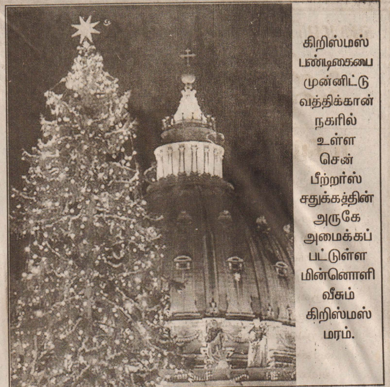
கிறிஸ்மஸ் மண்டிசையை முன்னிட்டு வத்திக்கான் நகரில் உள்ள சென் பீற்றர்ஸ் சதுக்கத்தின் அருகே அமைக்கப்பட்டுள்ள மின்னொளி வீசும் கிறிஸ்மஸ் மரம்.