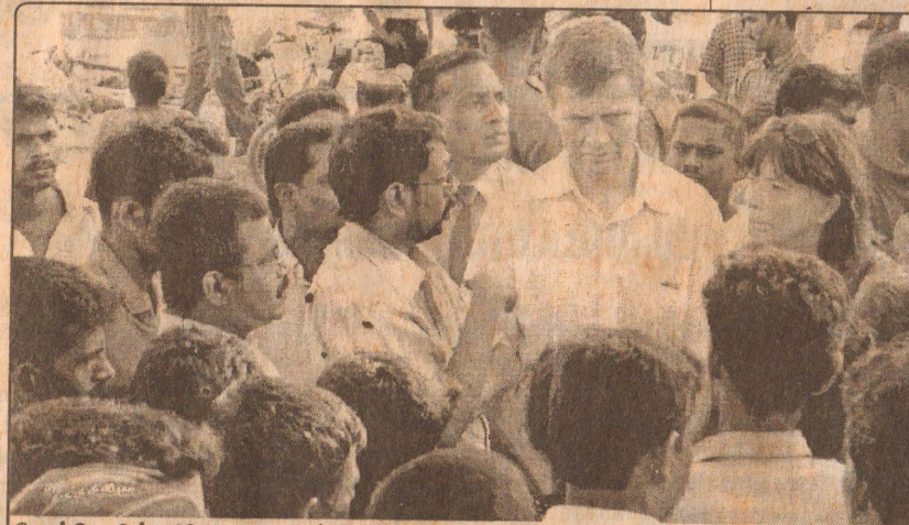
நோர்வேயின் வீசேட தூதுவர் எரிக்கொல்ஹெய்ம் நேற்றுமுன்தினம் கல்முனைக்குச் சென்று அங்குள்ள மக்களுடன் கலந்துரையாடுவதைப் படத்தில் காணலாம்.

இதனால் அவர் தலையில் படுகாயமடைந்தார். படுகாயமடைந்த நிலையில் மந்திகை வைத்தியசாலைக்கு கொண்டுசெல்லப்பட்டு அங்கிருந்து மேலதிக சிகிச்சைக்காக யாழ்ப்போதனா (12 ஆம் பக்கம் பார்க்க)