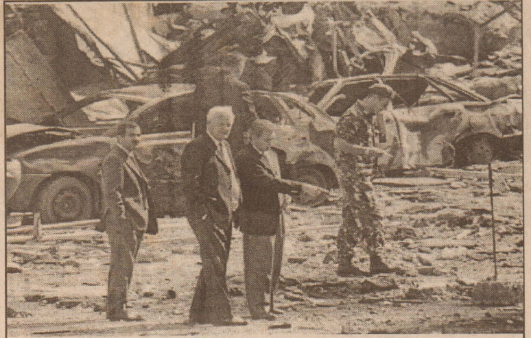
லெபனானில் சமீபத்தில் நடந்த குண்டுவெடிப்பில் முன்னாள் அதிபர் உட்பட பலர் பலியானார்கள். இது தொடர்பாக விசாரணை நடக்கும் ஐ.நா குழுவின் சம்பவ கிடத்தைப் பார்வை யீடுகின்றனர்.

இத் தற்கொலைத் குண்டுத்தாக்குதலில், 8பேர் உடல் சிதறிப் பலியானார்கள். 60க்கும் மேற்பட்டவர்கள் படுகாயமடைந்தனர். குண்டுவெடித்ததில் அந்த தற்கொலைப்படைத் தீவிரவாதியும் உடல் சிதறிப் பலியானான். அந்தப் பகுதி முழுவதும் புகை மண்டலமாகக் காட்சியளித்தது. பலஸ்தீனத்தின் மேற்குக்கரையில் இயங்கிவரும் ஒரு தீவிரவாத இயக்கம் இதற்குப் பொறுப்பு ஏற்றுள்ளது. அமைதி முயற்சியைக் சீர்குலைக்க நடத்தப்பட்ட இந்த வெடிகுண்டுத் தாக்குதலுக்கு இஸ்ரேல் பிரதமர் ஏரியல் ஷோரோன் மற்றும் பலஸ்தீனத் தலைவர் முகமது அப்தான் ஆகியோர் கடும் கண்டனம் வெளியிட்டுள்ளனர். (19)