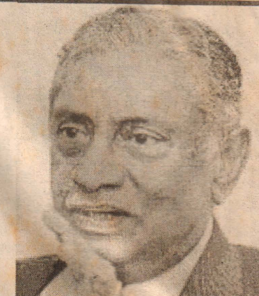
என இந்தியா விரும்புகிறது. எவ்வாறாயினும், தற்போதைய காலகட்டம் அரசியல் பேசுவதற்கான காலம் அல்ல. இதனை இரு நாடுகளும் புரிந்து வைத்திருக்கின்றன. பதிலாக, சனாமியினால் பாதிக்கப்பட்ட பகுதிகளைப் புனர்நிர்மாணம் செய்வதில் ஈடுபடுவதே இருநாடுகளினதும் நோக்கம் என்று குறிப்பிட்டார். இந்தியப் பிரதமர் மன்மோகன் சிங்கை நேற்றுமுன்தினம் சந்தித்த லக்ஷ்மன் கதிர்காமர் இந்தியா அளித்த உதவி குறித்து ஜனாதிபதி சந்திரிகா குமாரதுங்கவின் கடிதத்தை இந்தியப் பிரதமரிடம் கையளித்தார். அத்துடன், காங்கிரஸ் தலைவர் சோனியா காந்தியையும் அமைச்சர் லக்ஷ்மன் கதிர்காமர் சந்தித்துக் கலந்துரையாடினார். (ரு-4)

ஏனெனில், 'சனாமி' பேரளர்த்தம் போர் அம்சத்தில் இருந்து எம்மைக் காப்பாற்றியுள்ளது. இனிப் பல ஆண்டுகளுக்குப் போர் பற்றிய பேச்சு மக்கள் மத்தியில் கிடையாது. இதனை வைத்துப் பார்க்கும்போது எமக்கும் இவ் அச்சம் கிடையாது. தற்போதுள்ள சூழ்நிலையில் ஐக்கிய மக்கள் சுதந்திரக் கூட்டமைப்பு அரசாங்கத்திற்குள் கருத்து வேறுபாடுகள் காணப்படுகின்றன. அது வெறும் கருத்து வேறுபாடுகளே தவிர பிரிவினைக்கு இட்டுச் செல்லாது. அதற்கு நாங்கள் ஒருபோதும் அனுமதிக்கப் போவதும் இல்லை.