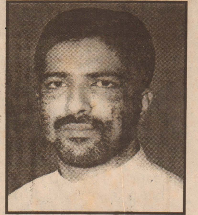
கிலேயே மீற்றுக்கு அப்பால் சில பிரதேசங்களுக்கு எமது மக்கள் செல்லமுடியாத நிலையுள்ளது. அந்தப் பிரதேசங்களில் எத்தனை பாடசாலைகள், எத்தனை கோவில்கள், எத்தனை ஆயிரம் வீடுகள் கைவிடப்பட்ட நிலையில் உள்ளன தெரியுமா? இதனைப் பற்றி யாரும் பேசமாட்டார்கள் எனவும் குறிப்பிட்டார். (று-4)