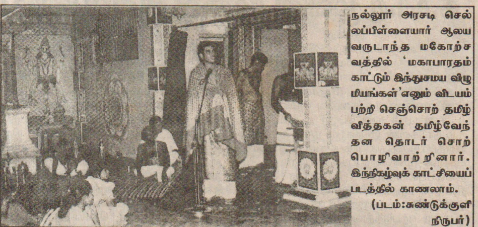
நல்லூர் அரசடி செல்லப்பிள்ளையார் ஆலய வருடாந்த மகோற்சுவத்தில் 'மகாபாரதம் காட்டும் இந்துசமய விழுமியங்கள்' எனும் விடயம் பற்றி செஞ்சொர் துழ்வித்தகன் தமிழ்வேந்தன தொடர் சொற்பொழிவுவார் ரினார். இந்நிகழ்வுக் காட்சியைப் படத்தில் காணலாம்.

ஜூன் மாதம் 30ஆம் திகதி மாகாண நிலை தமிழ்மொழித் தினப் போட்டிகளும் மறுநாள் 31ஆம் திகதி மாகாண நிலை தமிழ்மொழித் தினவிழாவும் நடைபெறவுள்ளமை இங்கு குறிப்பிடத்தக்கது. (க-126)