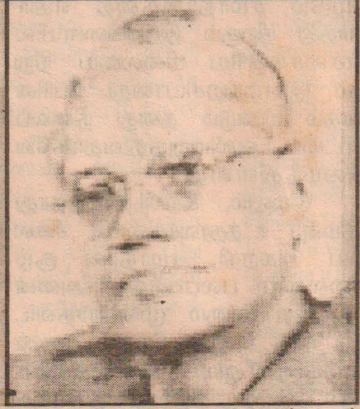
துப்புராக்க முடியாது எனவும் அவர் மேலும் தெரிவித்தார். (14-4)

இது தொடர்பாக அரசாங்கம் சகல தரப்பினருடனும் பேச்சுவார்த்தை நடாத்தியே தீரவேண்டும். ஜனாதிபதிக்கும் ஜே.விபிக்கும் இடையே இது தொடர்பாக இணக்கப்பாடு ஒன்று ஏற்பட வேண்டும். அவ் இணக்கப்பாடு இல்லாதமையே நாட்டில் தற்போது நடைபெற்று வரும் முழுப்பிரச்சினைக்கும் காரணமாகும். உட்புலத்துக்குத் தீவிரவாழ்வுப் படை மல் நிலவும் பிரச்சினைகள் விமர்சிக்கப்பட்டுவரும் வேளையில், சமாதான செயற்பாடுகளைச் சாதகமாக முடியுமா? என்பதை சிந்தித்துரைக்கையில்,