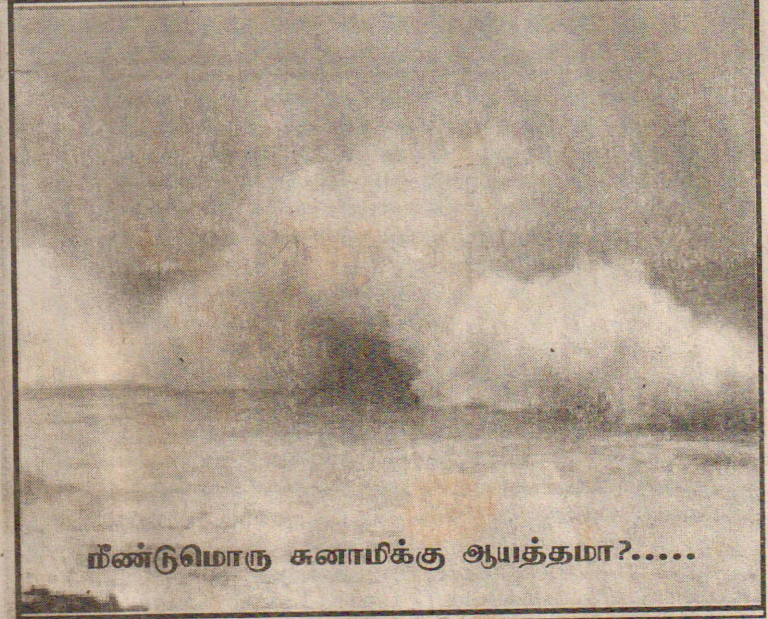
நீண்டுமொரு சுனாமிக்கு ஆயத்தமா?.....