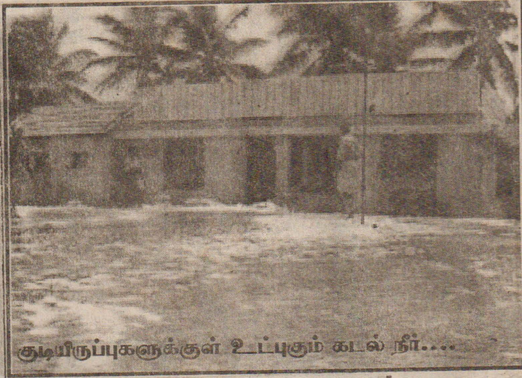
குடியிருப்புகளுக்குள் உட்புகும் கடல் நீர்....