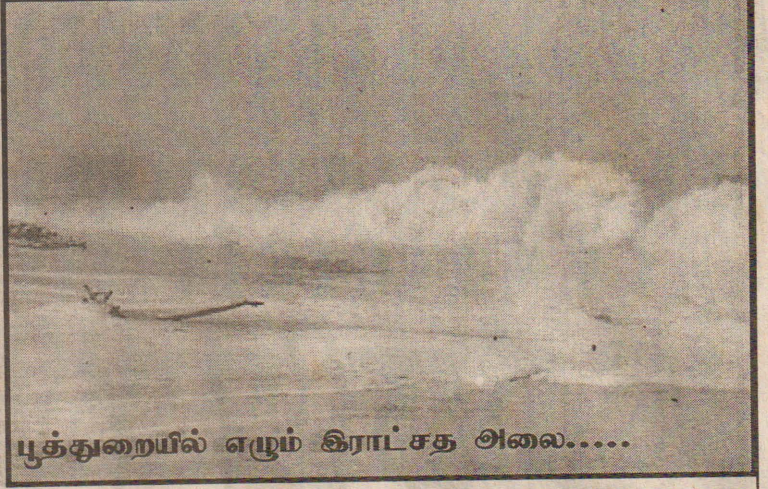
பூக்குறையில் எழும் கிராட்சத அலை.....