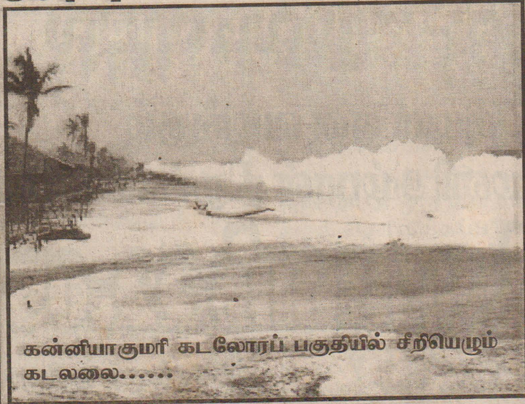
கன்னியாகுமரி கடலோரப் பகுதியில் சீர்வெறும் கடலலை.....