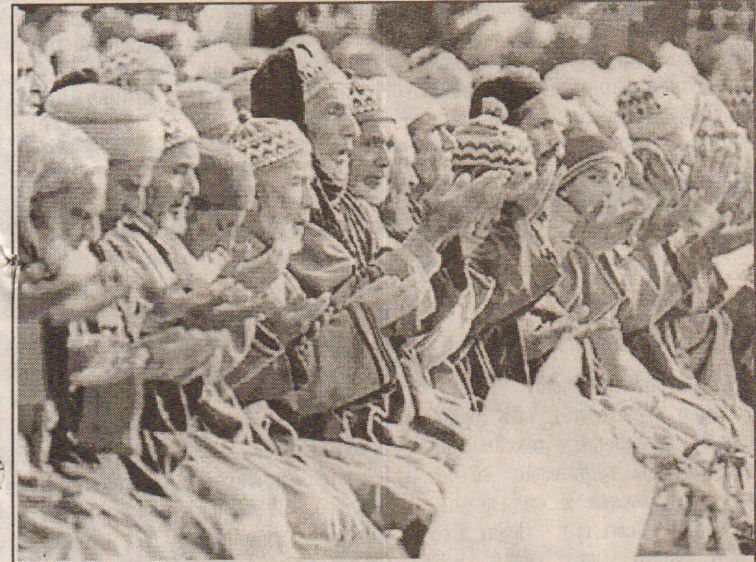
இந்தியா - பாகிஸ்தான் இடையேயான அமைதிப் பேச்சுவார்த்தை வெற்றிகரமாக முடியவேண்டும் என்பதற்காக காஷ்மீரின் பல்வேறு மசூதிகளிலும் சிறப்பு தொழுகைகள் நடைபெற்றன. ஸ்ரீநகரில் உள்ள மசூதி ஒன்றில் அமைதி வேண்டி தொழுகை நடத்தும் முஸ்லிம்கள்.