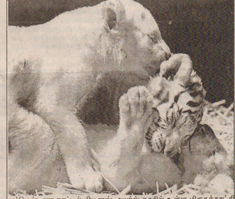
அர்ஜென்டினா நாட்டில் பியூனஸ் அயர்ஸ் நகரில் உள்ள மிருகக்காட்சி சாலையின் வெள்ளைப்புலி குட்டிகள் கொஞ்சி விளையாடும் காட்சி.

ரோங் என்ற அமெரிக்கரையே சாரும் என்பது குறிப்பிடத்தக்கது. (தி-9)