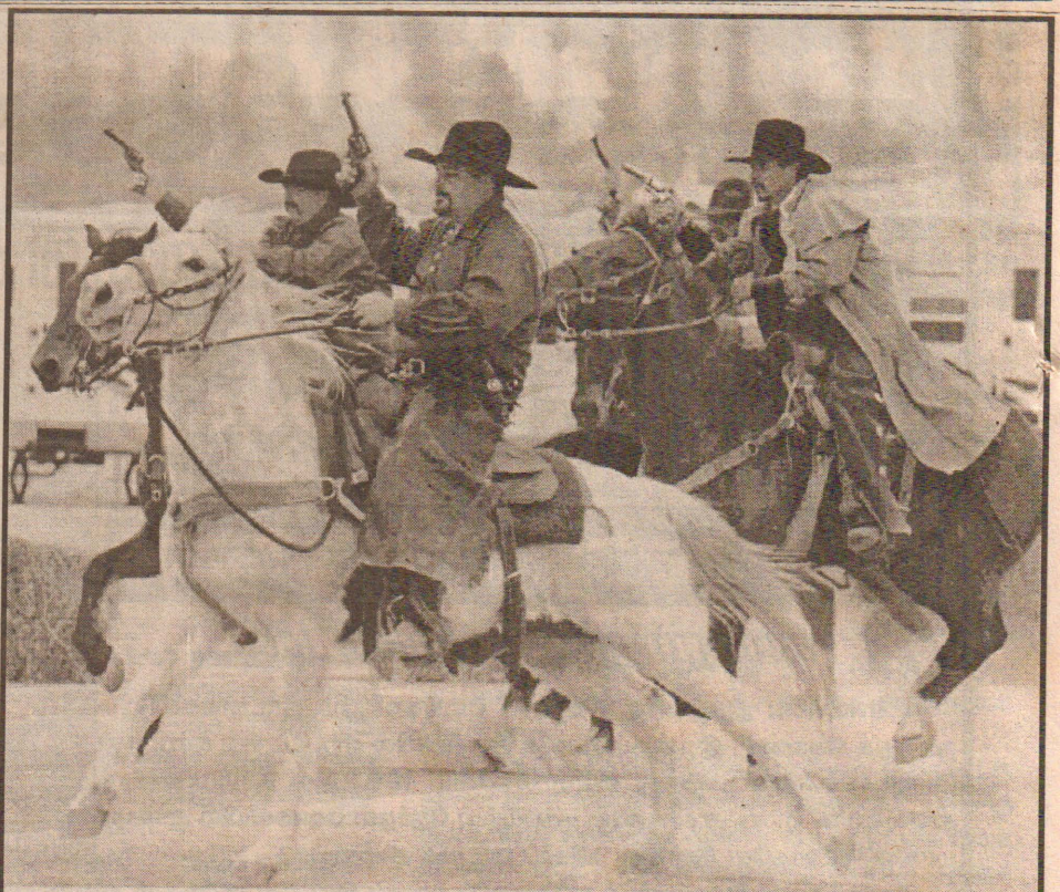
அமெரிக்காவில் டெக்சாஸ் மாகாணத்தில் கவ்பாய் திருவிழா நடந்தது. இதில் கவ்பாய் வேடமணிந்தவர்கள் குதிரையில் செல்கின்றனர்.