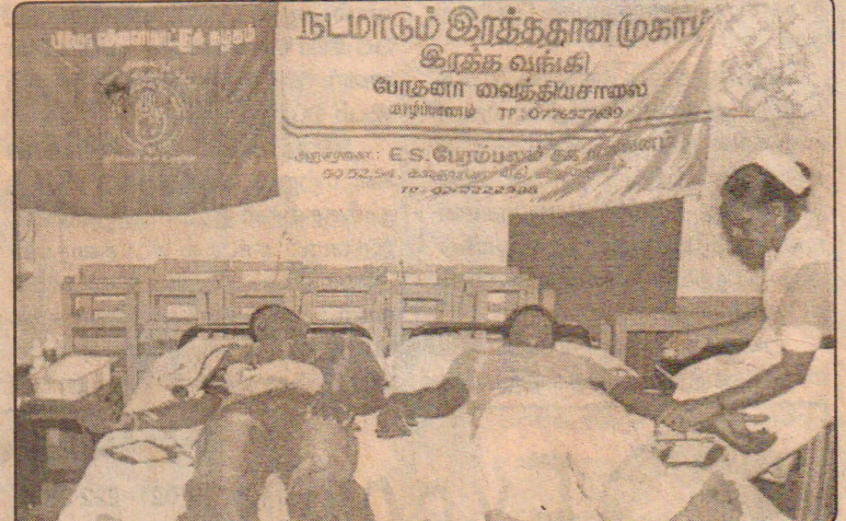
குருநகர் தாய் பியோ விளையாட்டுக் கழகத்தின் ஏற்பாட்டில் குருநகர் சென். ஜேம்ஸ் மகளிர் கல்லூரியில் கடந்த ஞாயிற்றுக்கிழமை இரத்ததான நிகழ்வு இடம்பெற்றது. இந்நிகழ்வில் இருவர் இரத்ததானம் செய்வதைப் படத்தில் காணலாம்.

நேற்று முன்தினம் காலை கொழும்பில் இடம்பெற்ற விசேட கூட்டமொன்றில் உரையாற்றும் போதே அமைச்சர் இதனைத் தெரிவித்தார். அறுவடை ஏற்கனவே ஆரம்பிக்கப்பட்ட பல்வேறு மாவட்டங்களுக்கு இந்த நிதி பகிர்ந்தளிக்கப்பட்டுள்ளமை குறிப்பிடத்தக்கது. (க-7)