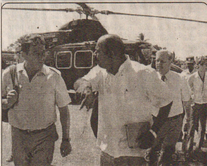
விசேட உலங்குவானூர்தி மூலம் கிளிநொச்சி சந்திரன் விளையாட்டரங்கில் வந்திறங்கிய கண்காணிப்புக் குழுத் தலைவர் ஹொக்லண்ட் குழுவினரை விடுதலைப் புலிகளின் சமாதான செயலகப் பணிப்பாளர் வரவேற்று அழைத்துச் செல்கிறார்...