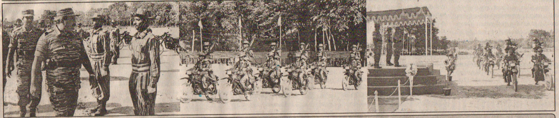
தமிழீழ விடுதலைப் புலிகளின் லெப்டினன்ட் கேணல் இம்ரான் பாண்டியன் படையணியின் அதிவேக மோட்டார் சைக்கிள் 2 ஆம் பிரிவின் சாகச நிகழ்வுகளையும், அவர்களின் அணிவகுப்பு மரியாதையையும் தேசியத் தலைவர் வே.பிரபாகரன் ஏற்றுக்கொள்வதை படங்களில் காணலாம்.

சங்கு 06 வள்ளுவர் ஆண்டு 2036 ஆனி 20 திங்கட்கிழமை (04.07.2005) தொலைபேசி 2223378, 2227644 ஒலி 197