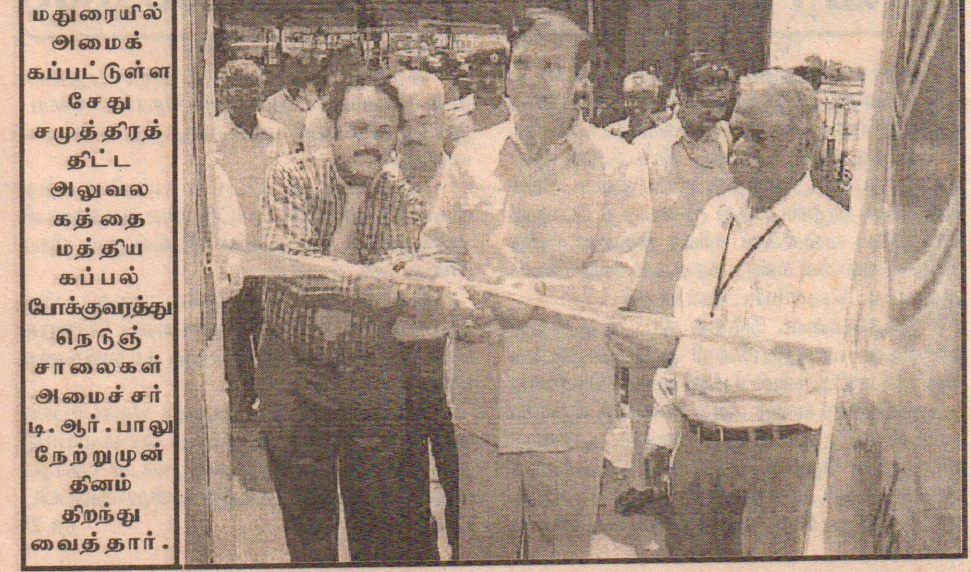
மதுரையில் அமைக்கப்பட்டுள்ள சேது சமுத்திரத் திட்ட அலுவலகத்தை மத்திய கப்பல் போக்குவரத்து நெடுஞ்சாலைகள் அமைச்சர் டி. ஆர். பாலு நேற்றுமுன்தினம் திறந்து வைத்தார்.