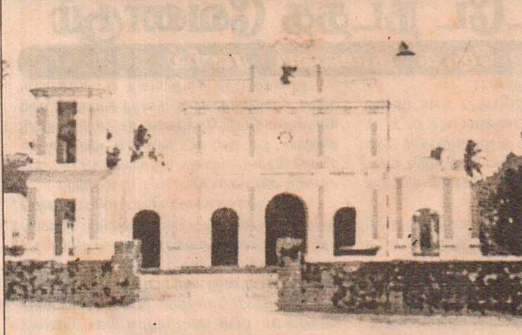
கடந்தகால யுத்த அனர்தகத்தால் சேதமடைந்து புனரமைக்கப்பட்ட உர்காவற்றுறை புனித யாகப்பர் ஆலயத்தின் புதியதோற்றம் இம்மாதம் 25ஆம் திகதி புனிதரின் திருவிழா என்பது குறிப்பிடத்தக்கது.