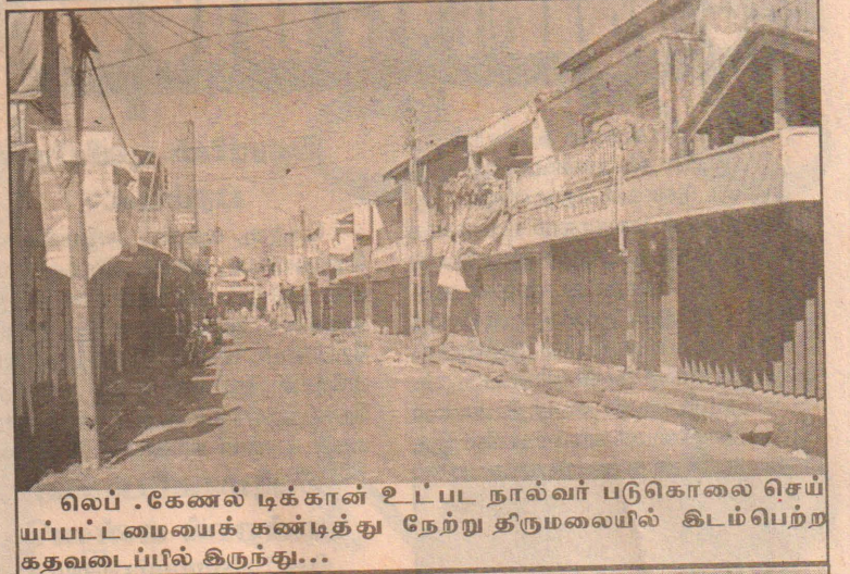
லெப். கேணல் டிக்கான் உட்பட நால்வர் படுகொலை செய்யப்பட்டமையைக் கண்டித்து நேற்று திருமலையில் கிடம்பெற்ற கதவடைப்பில் இருந்து...