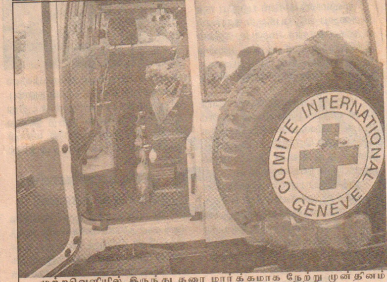
முற்றுவெளியில் இருந்து தரை மார்க்கமாக நேற்று முன்தினம் செஞ்சிலுவைச் சங்கத்தின் வழித்துணையுடன் சம்புருக்கு வீத்துடல்கள் எடுத்துச் செல்லப்படுகையில்...