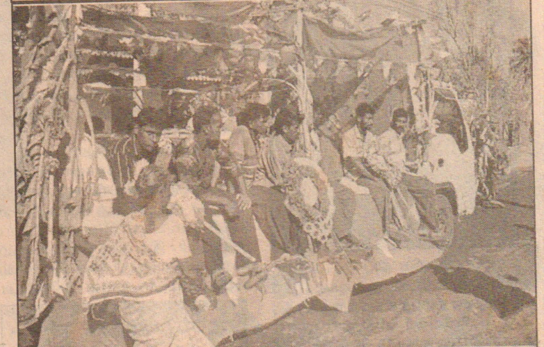
மக்கள் அஞ்சலிக்காக நேற்று முன்தினம் வீத்துடல்கள் விதி வழியாக எடுத்துச் செல்லப்படுகின்றன.