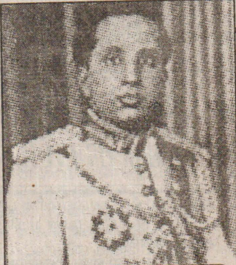
இளம் மன்னன் கிரண்டாம் ஃபைசல்

பாத்தாத் அரண்மனை விடிந்தும் விடியாத காலைப்பொழுது, இளம் மன்னன் கிரண்டாம் ஃபைசல் கண்விழித்து சோம்பல் முறித்தான்.