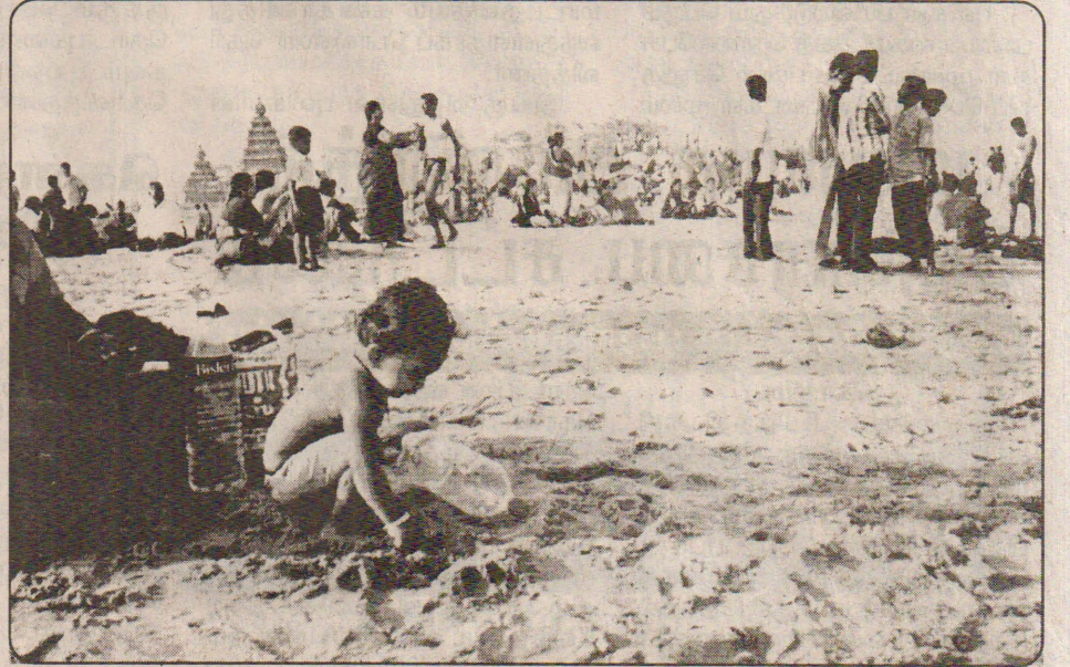
மாமல்லவீ கடலோரத்தில் மண்விளையாடும் குழந்தை

கிரவுச் சாப்பாட்டுக்காக மட்டுமே அந்தக் கடை திறக்கப்படும். லோயலாக்கொலிச் கொஸ்ரலில் இருந்த எமக்கு கிரவுச் சாப்பாட்டுக்காக வாடிக்கைக் கடையாக அதை வைத்துக்கொண்டோம். சிறிய கடையாக இருந்தமையால் எமக்கு விருப்பமான