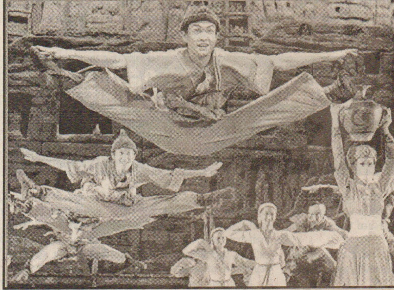
சீனாவில் லாங்குவின் பாட்டு மற்றும் நடனக்குழு தன்லுடைய திறமையை கிப்படி வெளிப்படுத்தி மக்களை ஆச்சரியப்படுத்தியது.

ஆயிரம் பேர் பலியாகி இருக்கிறார்கள் என்று கூறப்பட்டாலும் 1இலட்சத்துக்கும் மேற்பட்ட அப்பாவி மக்கள் பலியாகி இருப்பதாக அதிகாரபூர்வமற்ற தகவல்கள் தெரிவிக்கின்றன. ஈராக்கில் தீவிரவாதிகளைத் தேடிப் பிடித்து அழித்தவரும் அமெரிக்க இராணுவம் தீவிரவாதிகள் நடமாட்டத்தை தெரிவிப்பதற்காக இரகசிய ஏஜெண்டுகளை நியமித்துள்ளது. ஆனால் அவர்கள் தவறான தகவல்களைக் கொடுத்து விடுகின்றனர். அந்தத் தகவலை நம்பி அமெரிக்க இராணுவம் தாக்குதல் நடத்தும் போது அதில் அப்பாவி மக்கள் சிக்கி பலியாகிவிடுகின்றனர். அமெரிக்காவின் தாக்குதலில் முதல் ஆண்டை விட 2ஆவது ஆண்டில் பலியானோர் எண்ணிக்கை அதிகமாக உள்ளமை குறிப்பிடத்தக்கது. (11)