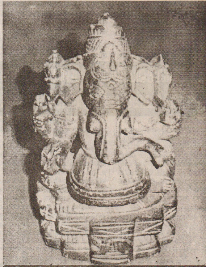
விடுகளில் வைப்பதற்காக மாமல்லபுரத்தில் விற்கப்படும் வீரநாயகர் சிலை.

மாமல்லபுரத்தில் அவரவர் வாங்கிக் கொண்ட கற்சிலைகளுடன் பஸ் நிலையத்தில் காத்திருந்தோம். கோயம்பேடு பஸ் நிலையத்திற்குச் சென்றால் மட்டுமே அங்கிருந்து நுங்கம் பாக்கத்தை அடையமுடியும். கோயம்பேடு பஸ் நிலையத்திற்குச் செல்கின்ற பஸ்கள் எல்லாமே பயணிகளின் பாரமிகுதியால், எவ்விடத்திலும் தரீக்காமல் சென்று விட்டன.