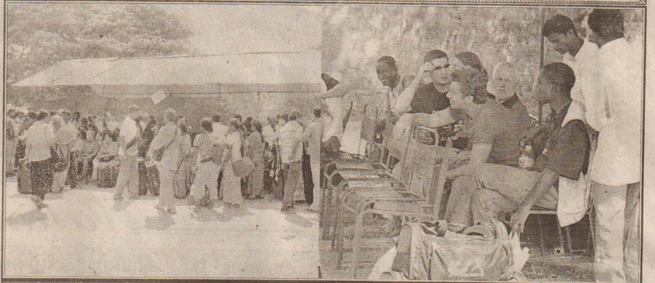
செஞ்சிலுவைச்சங்கத்தின் வழித்துறையுடன் திருமலை நோக்கி புறப்படும் செருவா கப் பல்லில் செல்வதற்கு பயண ஆயத்தங்களுடன் சிங்கள மகாவித்தியாலைய மைதானத்தில் குழுமி இருக்கும் பயணிகள்.

இத் துப்பாக்கிச் சூட்டுச் சம்பவத்தில் 30 வயதுடைய தந்தையும் 7 வயதுடைய மகனுமே கொல்லப்பட்டவர்களாவர். (ச-7)