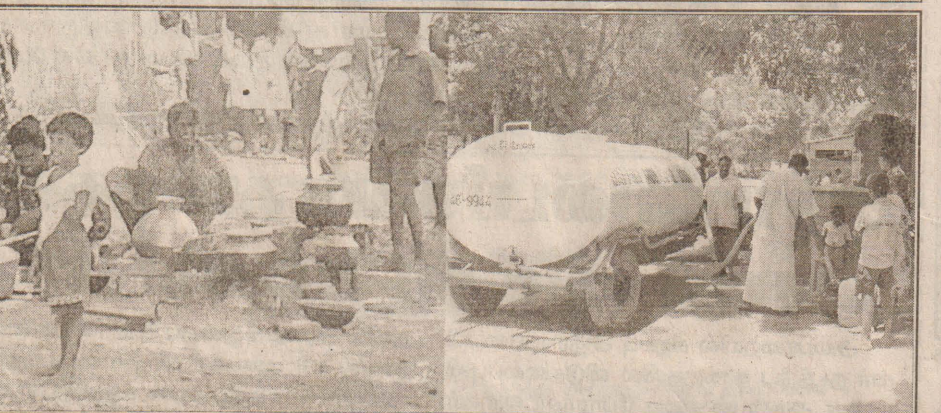
திவகத்திலிருந்து இடம்பெயர்ந்து யாழ்ப்ப. அடைகலமாக தேவாலயத்தில் கஞ்சம் புகுந்திருக்கும் அகதிகள் மர நிறுவில் சமையலில் ஈடுபட்டுள்ளதையும் இவர்களுக்கான குடிநீர் யாழ்ப்ப. மாகாணமையினால் பெணர் மூலம் விநியோகிக்கப்படுவதையும் படங்களில் காணலாம்.

கள், நான்கு டெட்டனைட்டர்கள், எட்டு கைக்குண்டுகள், ஒரு ரி-56 ரகத் துப்பாக்கி, 115 ரவைகள் என்பவை மீட்கப்பட்டதாக அவர் கூறினார். இதையடுத்து மேற்கொண்ட விசாரணைகளின்போது 16 ஆண்களும் இரண்டு பெண்களும் கைது செய்யப்பட்டுள்ளனர். (ச)