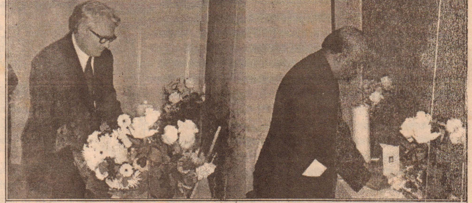
தமிழீழ விடுதலைப்புலிகளின் அரசியல் ஆலோசகரும் தத்துவாசிரியருமான தேசத்தின் குரல் அன்ரன் பாலசிங்கத்திற்கு கண்ணீர் வணக்க நிகழ்வு நோர்வேயில் நடைபெற்றது. இந்நிகழ்வு நோர்வேத் தலைநகர் ஓஸ்லோவில் நேற்று முன்தினயிரவு 7 மணி முதல் 9 மணிவரை நடைபெற்றது. (04 ஆம் பக்கம் பார்க்க)