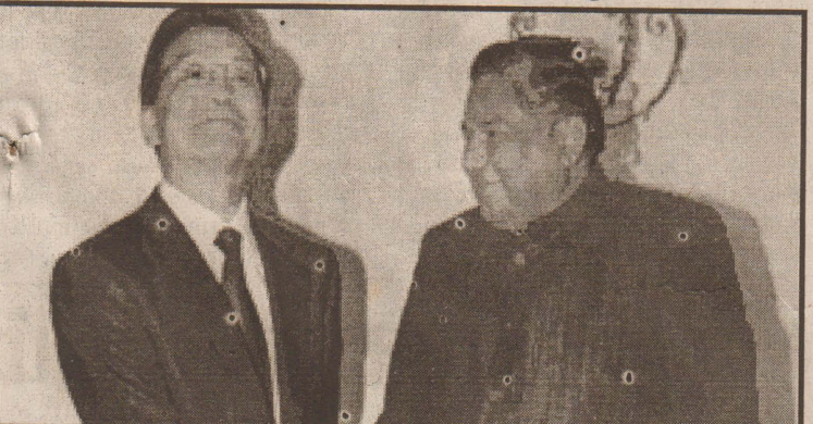
இந்தியா சென்றுள்ள சீனப் பிரதமர் வென்ஜியாபோ, பெங்களூரில் கர்நாடக முதல்வர் தரம்சிங்கை சந்திக்கும் பேசினார்.