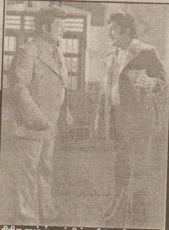
திரிகூலம் படத்தில்... (1979)

நாங்களும் சாமான்களை விட்டுவிட்டு, அம்போ என்று பொள்ளாச்சி வந்துவிட்டோம். பொள்ளாச்சியில் எங்கள் நாடகக் கம்பெனி பார்ட்னர்களான செட்டியார்களுக்கும், ராதா அண்ணனுக்கும் கொஞ்சம் பணத்தகராறு வந்துவிட்டது. ஆகையால் நடிகவேள் அவர்கள், அவர்களை விட்டு விலகி, வேறு ஊர் செல்ல ஆரம்பித்துவிட்டார்.