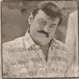
புரட்சிக் கலைஞர் விஜயகாந்த்