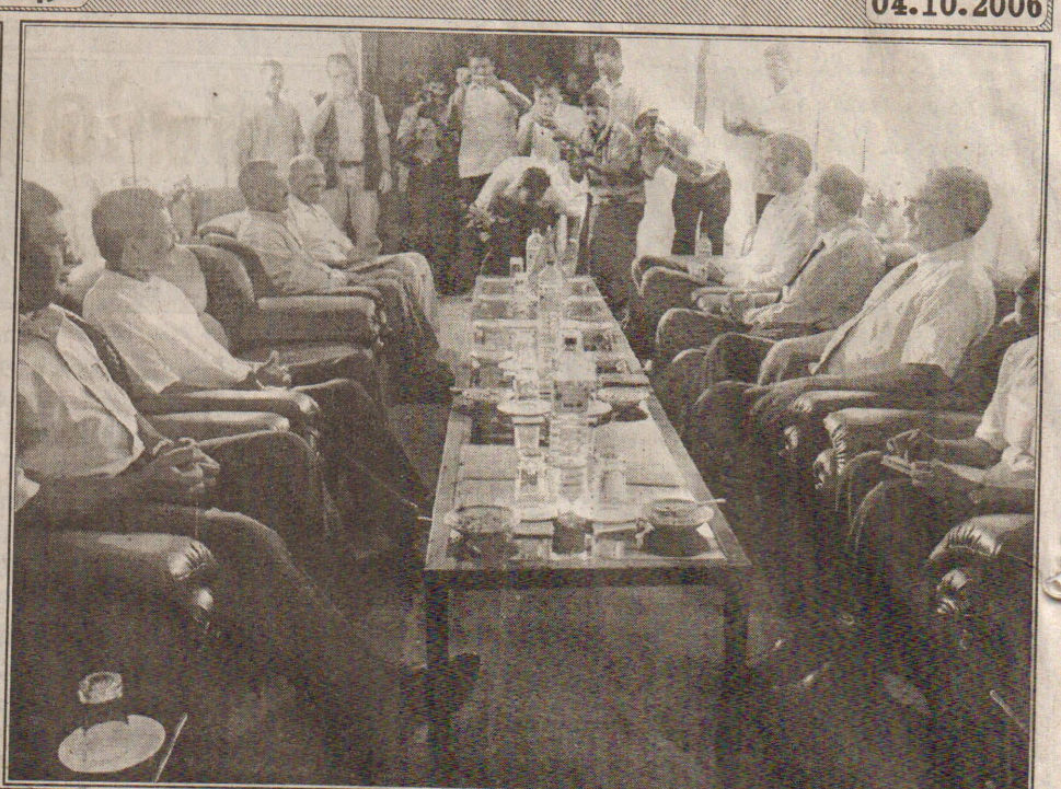
நேற்று கிளிநொச்சிக்குச் சென்ற நோர்வேயின் விசேட சமாதானத் தூதுவர் ஜோன் ஹான்சன் பெளயர் விடுதலைப்புலிகளின் அரசியல்துறைப் பொறுப்பாளருடன் பேச்சில் ஈடுபடுவதை படங்களில் காணலாம்.