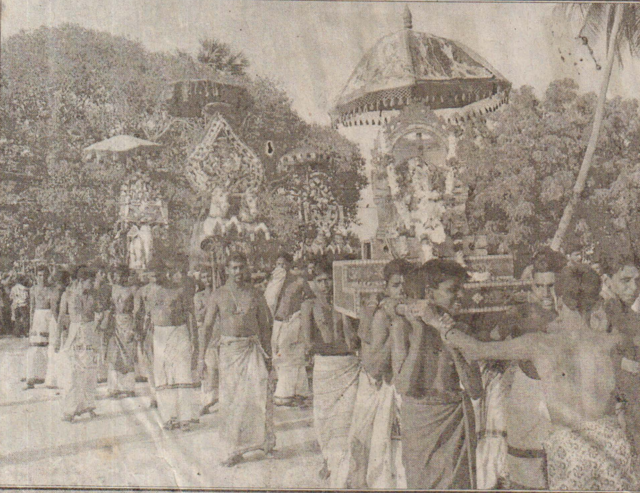
கடந்த முதலாம் திகதி வல்லிபுர ஆழ்வார் ஆலயத்தில் இடம்பெற்ற மஹோற்சவத்தில் சுவாமி வீதியூலா வரும் காட்சியைப் படத்தில் காணலாம்.