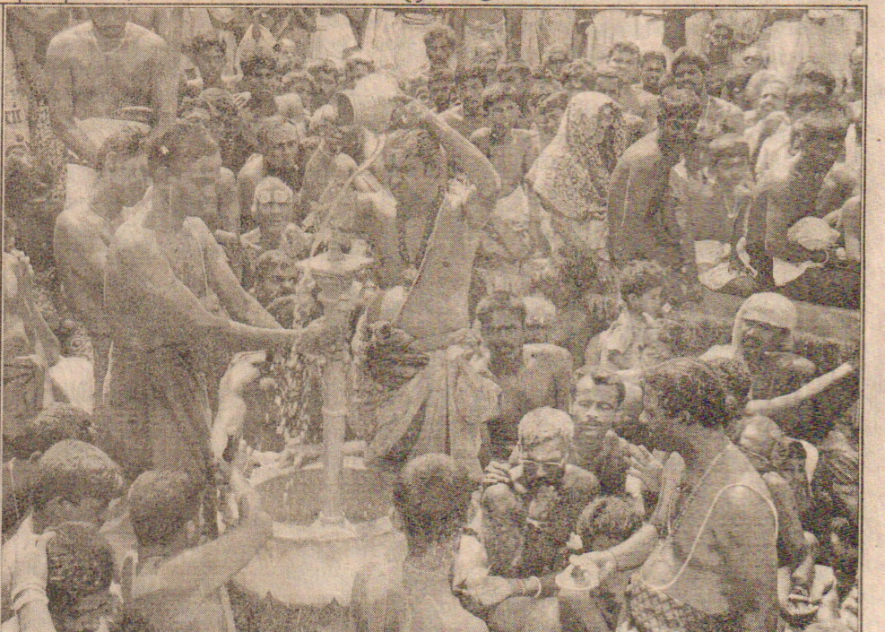
வல்லிபுர ஆழ்வார் ஆலய சமுத்திரத் தீர்த்த உற்சவம் 50 பேருக்கு மத்தியில் நேற்று முன்தினம் நடைபெற்ற போது எடுக்கப்பட்ட படங்கள்.