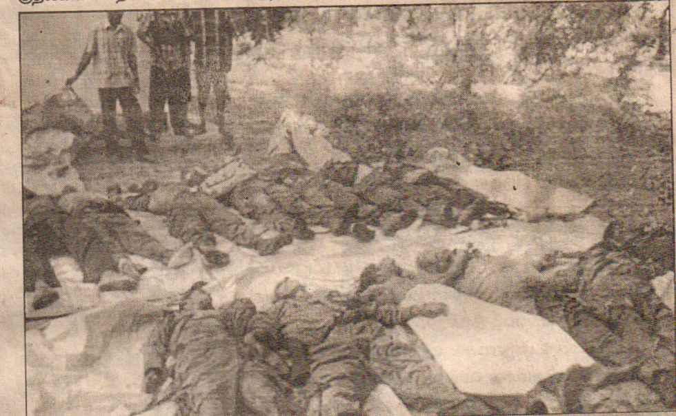
மட்டக்களப்பு பனிச்சங்கேணியில் மீட்கப்பட்ட இராணுவத்தினரின் சடலங்கள் எனத் தெரிவித்து விடுதலைப்புலிகளினால் நேற்று வெளியிடப்பட்ட படம் இது.

நிகழ்ச்சி நிரல் தயாரிக்கப் படவுள்ளது. நிகழ்ச்சி நிரல் தயாரிக்கப்பட்டு இரு தரப்பினரும் ஏற்றுக் கொண்டதும் இம் மாதம் 28, 29 ஆம் திகதிகளில் பேச்சுக்கள் நடைபெறும் என்றும் நோர்வேத் தகவல்கள் தெரிவித்தன. தற்பொழுது திசெரென ஏற்பட்டுள்ள மோதல்களினால் ஏற்பட்டுள்ள சிக்கல் நிலை குறித்து கூடுதல் கவனம் செலுத்தவேண்டியுள்ளதாகவும் தெரிவிக்கப்பட்டுள்ளது. இதேவேளை நிகழ்ச்சி நிரல் தயாரிக்கப்பட்டதும் எளிக்கொள் ஹெய்ம் மற்றும் பெளயர் இந்தியாவுக்குச் சென்று அங்கிருந்து நோர்வேக்குத் திரும்புவார்கள் என கொழும்புச் செய்திகள் தெரிவித்தன. (ச-9)