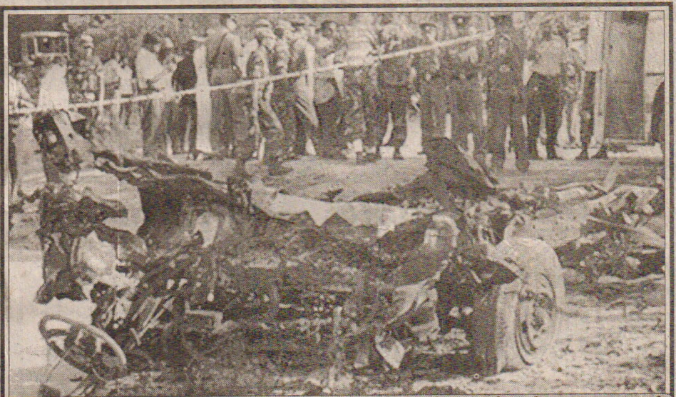
தற்கொலை தாக்குதல் நடத்த பயன்படுத்தப்பட்டதாகக் கூறப்படும் ஹன்டர்...

ஹன்டர் வாகனத்தில் சென்றே இத் தற்கொலைத் தாக்குதல் மேற்கொள்ளப்பட்டுள்ளது எனத் தெரிவிக்கப்பட்டுள்ளது. (04 ஆம் பக்கம் பார்க்க)