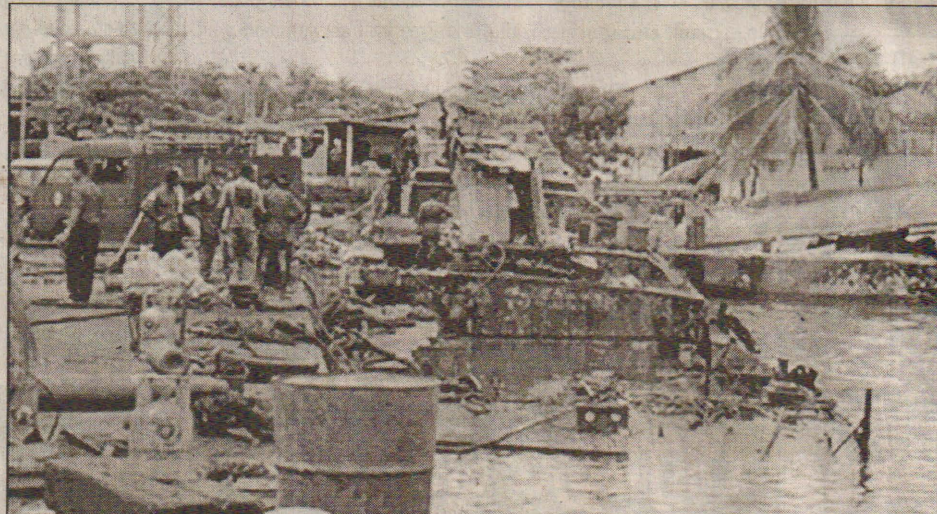
காலித் துறைமுகத்தில் நேற்று முன்தினம் மேற்கொள்ளப்பட்ட தாக்குதலின் போது சேதமடைந்த நிலையில் காணப்படும் கம்பலையும் துறைமுகத்தையும் படத்தில் காணலாம்.

குப்பைக்குள் மறைத்து இக் குண்டு வைக்கப்பட்டிருந்தது. கணேமுல்லை சிறிலங்கா இராணுவ முகாமைச் சேர்ந்த குண்டு செயலிழக்கச் செய்யும் அணி சம்பவ இடத்துக்கு சென்று கிளைமோரை செயலிழக்கச் செய்த தாகவும் தெரிவிக்கப்பட்டது. (ச-5)