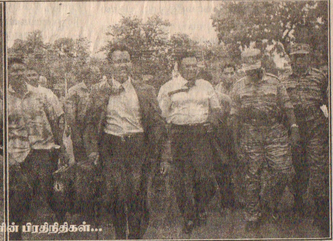
கிளிநொச்சியிலிருந்து நேற்றுக் காலை கொழும்பு திராக்கியப் புறப்படத் தயாராக இருந்த விடுதலைப்புலிகளின் பிரதிநிதிகள்...