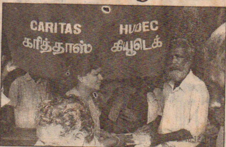
CARITAS HV/EC கரித்தாஸ் கியூடெக்