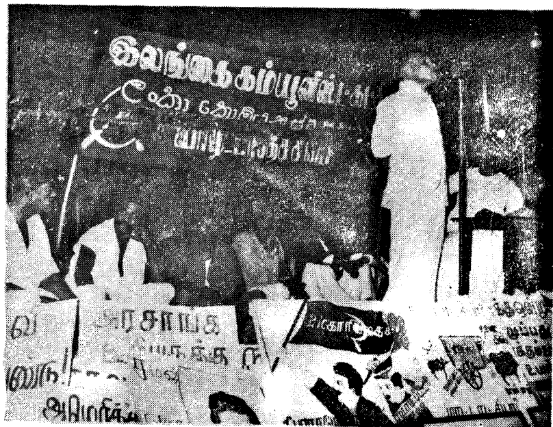
1964ஆம் ஆண்டின் பிரமாண்டமான மேதினக் கூட்ட மேடையில் இடமிருந்து நான்காவதாக அ மர்திருக்கிறார்.