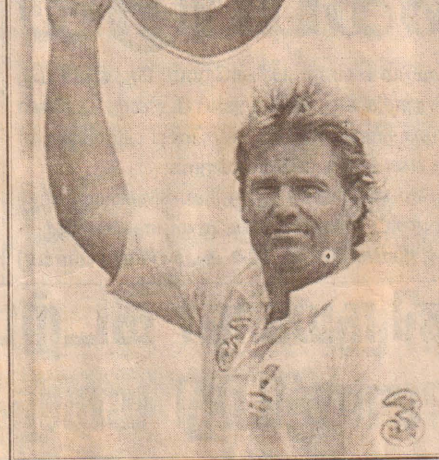
வது டெஸ்ட் போட்டி. அவர் சராசரியாக ஒரு விகிதகட்டை வீழ்த்த 25.48 ஓட்டங்களைக் கொடுத்துள்ளார்.

(மெல்பேர்ன்) மெல்பேர்ன் கிரிக்கெட் மைதானத்தில் நேற்று ஆரம்பமான ஆஷஸ் தொடரின் நான்காவது டெஸ்ட் போட்டியில் அஷஸ்தீ ரேலிய சுழல் பந்து வீச்சாளர் ஷேன்வோர்ன் 700-வது விகிதகட்டை வீழ்த்தி உலகில் அதிக விகிதகட்டை எடுத்தவர் என்ற சாதனையைப் பெற்றுள்ளார். மெல்பேர்ன் கிரிக்கெட் மைதானத்தில் இங்கிலாந்துக்கு எதிராக நேற்று நடந்த நான்காவது ஆஷஸ் டெஸ்ட் போட்டியில் முதல் நாள் ஆட்டத்தின் போது ஷேன்வோர்ன் இந்த சாதனையை நிகழ்த்தினார். நான்காவது ஆஷஸ் போட்டியின் ஆரம்ப நாளன்று இங்கிலாந்தின் ஆரம்பத் துடுப்பாட்ட வீரர் ஆண்ட்ரூஸ் ரோக்ஸ் இவர் வீழ்த்தி இந்தச் சாதனையை நிகழ்த்தினார். ஸ்ரோஸ் 50 ஓட்டங்கள் எடுத்த வேளையில் ஷேன்வோர்ன் அவரை வீழ்த்தியுள்ளார். 37 வயதான ஷேன்வோர்ன் அடுத்த வாரம் நடக்கவிருக்கும் 5-வது ஆஷஸ் டெஸ்ட் போட்டி முடிந்ததும் கிரிக்கெட்டிலிருந்து ஓய்வு பெறப் போவதாக சமீபத்தில் அறிவித்திருந்தார்.