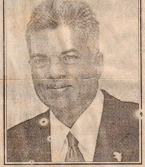
செலுத்தி வருகின்றோம். அதன் ஊடாகவே நாட்டை அபிவிருத்தி செய்ய முடியும் என்பதுடன் நாட்டில் அமைதியையும் ஏற்படுத்த முடியும். (சு)

ஆனால் சில கட்சிகள் அரசாங்கத்தின் செயற்பாடுகளுக்கு எதிர்ப்புத் தெரிவித்து சில கொள்கைகளுக்காக முரண்பட்டுக் கொண்டு பிரிந்து நிற்கின்றன. இவ்வாறு பிரிந்து இருப்பதன் மூலமாக இனப்பிரச்சினைக்கு என்றுமே தீர்வு காண முடியாது. யுத்தத்தை நிறுத்தி சமாதானத்தை ஏற்படுத்த வேண்டும் என்பதில் நாம் கூடிய கவனம்