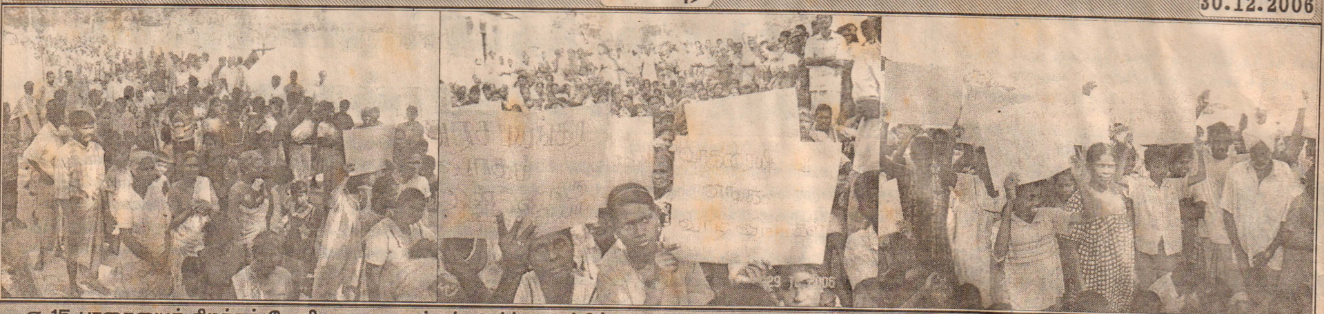
ஏ-15 பாதையைத் திறக்கக் கோரி வாகரை மக்கள் ஆர்ப்பாட்டத்தில் ஈடுபட்டனர். பாதைகளுடன் காணப்படும் ஆர்ப்பாட்டக்காரர்களைப் படங்களில் காணலாம்.