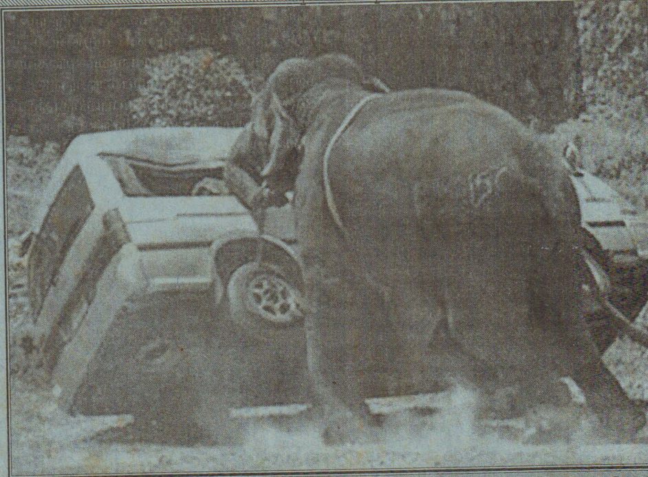
காணியில் நேற்று மூத்தவர் இடம்பெற்ற யானைகள் விளையாடும் போலோ போட்டியின் போது யானை ஒன்று மதம் கொண்டு அதற்குள் அடொக்கரை வீழ்த்தியிருக்கிறது. (சு)

45டி 5சி ரக மற்றும் இரு டி - 81 ரக ஆயுத துப்பாக்கிகளும் 210 மகசின்களும் இராணுவத்தினரால் மீட்கப்பட்டுள்ளது. இதனையடுத்து இராணுவத்தினர் தேடுதல் நடவடிக்கையில் ஈடுபட்டுள்ளதாக தேசிய பாதுகாப்பு ஊடக மத்திய நிலையம் மேலும் தெரிவித்துள்ளது. (சு)