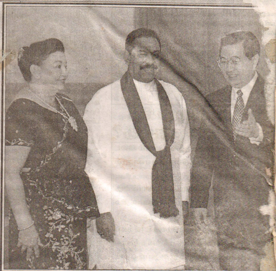
சீனா சென்றுள்ள ஜனாதிபதி மகிந்த ராஜபக்ஷவையும் அவரது மைத்துனரையும் அந் நாட்டு ஜனாதிபதி வரவேற்பதை படத்தில் காணலாம்.

ஆயினும் இலங்கையில் தற்போது தமிழ் மக்களுக்கு ஏற்பட்டுள்ள இன்னல்களைக் கருத்தில் கொண்டு இவர்களுக்கு அகதி அந்தஸ்து அளிக்காமாறு கோரி தற்போது பல அழுத்தங்களும் எழுந்துள்ளமை குறிப்பிடத்தக்கது. (ந-5)