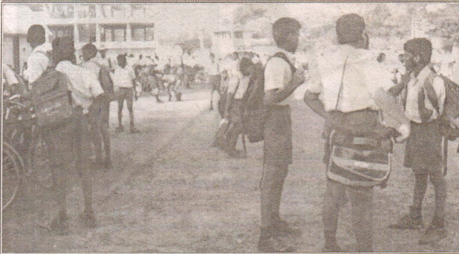
யாழ்.இந்துக் கல்லூரியில் நேற்று படையினர் நடத்திய தேடுதலின் போது மாணவர்கள் மைதானத்தில் நிற்பதைப் படத்தில் காணலாம்.