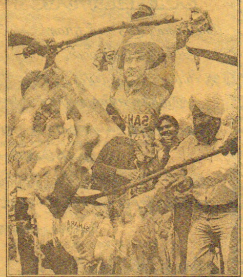
உலகக் கிண்ணத்திற்கான லீக் போட்டியில் இந்திய கிரிக்கெட் அணி, இலங்கை அணியிடம் தோல்வியுற்றதால் ஆத்திரமடைந்த இந்திய அணி ரசிகர்கள், அந்நாட்டு கிரிக்கெட் வீரர்களின் படங்களை தீயிட்டுக் கொடுத்துவதை படத்தில் காணலாம்.

அது குறித்து எவ்வித நடவடிக்கைகளும் மேற்கொள்ளப்படாததை குறித்து எதிர்க்கட் சித்தலைவர் ரணில் விக்கிரமசிங்க சபாநாய கர் வி.ஜே.மு.லொக்குபண்டாரவை சந்தித்து உரையாடவுள்ளார். (04 ஆம் பக்கம் பார்க்க)