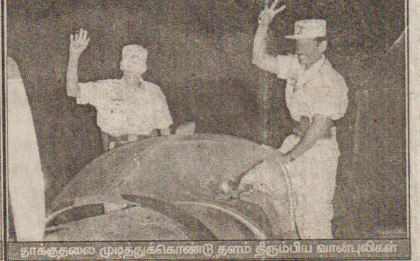
தாக்குதலை முடித்துக்கொண்டு தளம் திரும்பிய வான்புலிகள்