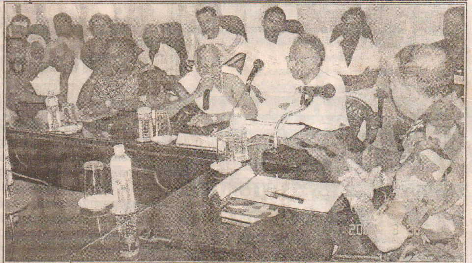
யாழ்.இந்து மதகுருமார்களுக்கும் யாழ். இராணுவத் தளபதிக்கு மிடையில் பலாலியில் நேற்று சந்திப்பொன்று இடம் பெற்றது. அதனைப் படத்தில் காணலாம்.

இந்த விமானங்கள் இரண்டும் வவுனியா கணேசபுர கிராமத்திற்கு மேலாகச் சென்றதைக் கண்ட பொலிஸாரும் இராணுவத்தின