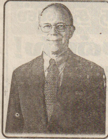
அதாவது முழு தென் ஆசியப் பிராந்தியத்திற்கான கேந்திர முக்கிய நகர்வுகளை தீர்மானிக்கும் அசைவியக்க சக்தி மையம் (Pivotal Force) இலங்கை என்பதே

சீனாவின் அபரிமிதமான வளர்ச்சியே இவ்வாறான தத்துவங்களை அமெரிக்கவாய்ப்பாக உதிர்க்க வைக்கிறது. சீனாவை கண் காணிக்க சிங்கப்பூர் போதும் என்பதே சொல்லப்படாத செய்தி. தென் ஆசியாவின் கடல் வழி தலை வாசல் பாதையில் திருமலைத்துறைமுகம் இல்லை என்பதையும் தூதுவர் முன்