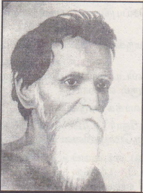
சர்வோதயத்தின் சிற்பி புனிதர் வினோபா

சர்வோதயத்தின் சிற்பி வினோபா அடிகளின் 114ஆவது பிறந்த நான் நினைவு தினம் செப்டெம்பர் 11 ஆகும். மகாத்மா காந்தியடிகளுக்குப் பின்பு இந்திய தேசத்திலும் வெளி உலகத்திலும் போற்றப்படும் ஒப்பற்ற பெரியார் வினோபாஜி. சத்தியாக்கிரகம் கண்ட மகரிஷியான மகாத்மா காந்தி வினோபாவை முதல் சத்தியாக்கிரகி என்று பெருமை கொள்கிறார். 1940 இல் சேவா கிராம ஆசிரமத்திலிருந்து வினோபா பற்றி காந்தி அடிகள் எழுதிய குறிப்பை வினோபாஜியின் பிறந்தநாள் நினைவாக பிரசுரிக்கிறோம்.