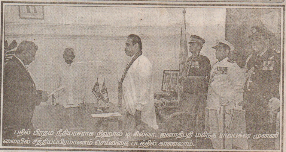
பதில் பிரதம நீதியரசராக நிறுவால் டி.சி.வா. ஜனாதிபதி மகிந்த ராஜபக்ஷ முன்னிலையில் சத்திப்பிரமாணம் செய்வதை படத்தில் காணலாம்.

(கொழும்பு) பால்மா வகைகளின் விலைகளை இந்த வாரம் அதிகரிப்பதற்கு நுகர்வோர் அலுவல்கள் அதிகார சபை மற்றும் வர்த்தக நுகர்வோர் அலுவல்கள் அதிகாரசபை என்பன ஆராய்ந்து வருவதாக தெரிவிக்கப்படுகின்றது. 450 கிராம் நிறையுள்ள ஒரு பால்மா பக்கற்றின் விலை 50 சதத்தால் அதிகரிக்கத் திட்டமிடப்பட்டுள்ளதாகவும் தெரிவிக்கப்படுகின்றது. பால்மா வகைகளை இறக்குமதி செய்வோரும் உற்பத்தியாளர்களும் அடுத்த வாரத்திற்குள் இவ் அதிகரிப்பை மேற்கொள்வதற்கு அனுமதி கேட்டுள்ளனர். பால்மாக்களின் விலை உலக சந்தையில் அதிகரித்துள்ளமையும் அவுஸ்திரேலியாவில் ஏற்பட்டுள்ள வரட்சி காரணமாக பால்மாக்களின் விலை அதிகரித்துள்ளது. அத்துடன் நாட்டில் தற்போது அதிகரித்து வரும் எரிபொருள் விலையேற்றத்தால் மின் கட்டணங்களின் அதிகரிப்பு பால்மா உற்பத்தி இறக்குமதிச் செலவு அதிகரிப்பு என்பவற்றினாலேயே பால்மாக்களின் விலையை அதிகரிப்பதற்கு அனுமதி கோரியுள்ளனர். பால்மாக்களின் விலையை அதிகரிக்க அனுமதிக்காவிடின் விற்பனையை நிறுத்தப்போவதாக இறக்குமதியாளர்களும் உற்பத்தியாளர்களும் அரிசாங்கத்தை எச்சரித்துள்ளனர். (ச-5)