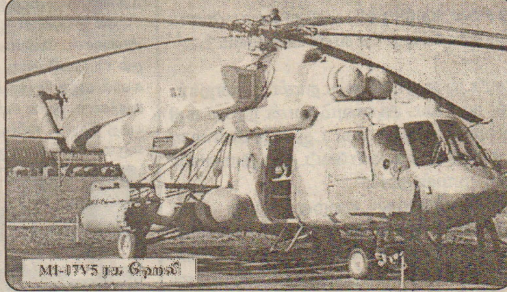
MI-17V5 ரக ஹெலிகாப்டர்

அதாவது இலங்கையும் இந்தியாவும் சோவியத் ஒன்றியம், இஸ்ரேல் போன்ற நாடுகளின் கனரக ஆயுதங்களை அல்லது அவற்றை ஒத்த ஆயுதங்களையே பெரும்பாலும் பயன்படுத்தி வருகின்றன. உதாரணமாக டோரா பிரங்கிப்படைகள் அன்றனோவ் -32 பி, அன்றனோவ் 24 போக்குவரத்து விமா