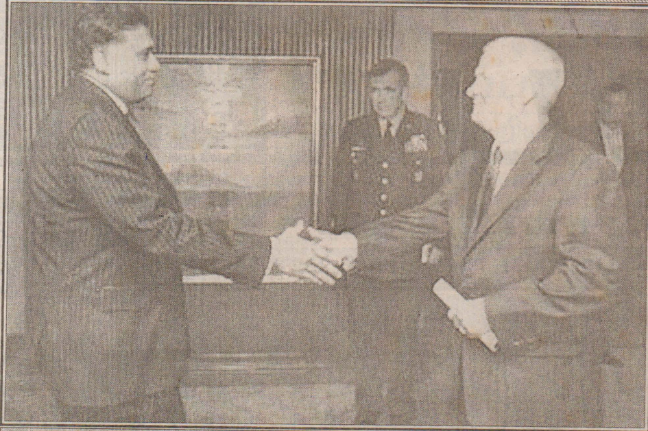
இலங்கை வெளிவிவகார அமைச்சர் ரோகித போகொல்லாகம நேற்று சிங்கப்பூரில் அமெரிக்க பாதுகாப்பு அமைச்சர் ஹென்றைச் சந்தித்த போது...