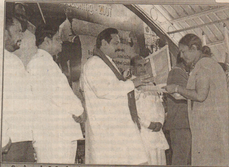
தேசிய கல்வியியற் கல்லூரி டிப்ளோமாய் பட்டத்தில் உயர் சித்தியடைந் தோருக்கு ஆசிரியர் நியமனம் வழங்கும் வைபவம் அலரிமாளிகையில் நடைபெற்றது. இவ் வைபவத்தில் ஜனாதிபதி மகிந்த ராஜபக்ஷவினால் டிப்ளோமாதாரி ஒருவருக்கு நியமனக் கடிதம் வழங்கப்படுவதைப் பட்ட தில் காணலாம்.