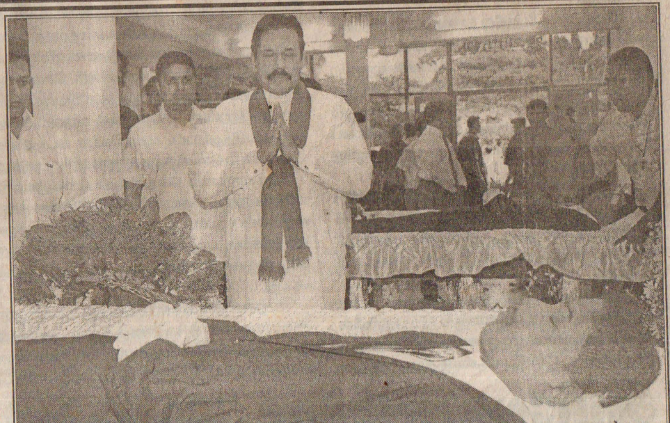
இரத்தினபுரியில் சடலமாக மீட்கப்பட்ட இலங்கை செஞ்சிலுவைச் சங்கப் பணியாளர்களின் பூதவுடலுக்கு ஜனாதிபதி மகிந்த ராஜபக்ஷ நேரில் சென்று அஞ்சலி செலுத்துவதைப் படத்தில் காணலாம்.

முக்கிய நகரங்களில் நடைபெற்ற எதிர்ப்பு ஆர்ப்பாட்டங்களில் ஜே.வி.பியின் நாடாளுமன்ற உறுப்பினர்கள் கலந்து கொண்டனர். பொருள்களின் விலையுயர்வால் மக்களு