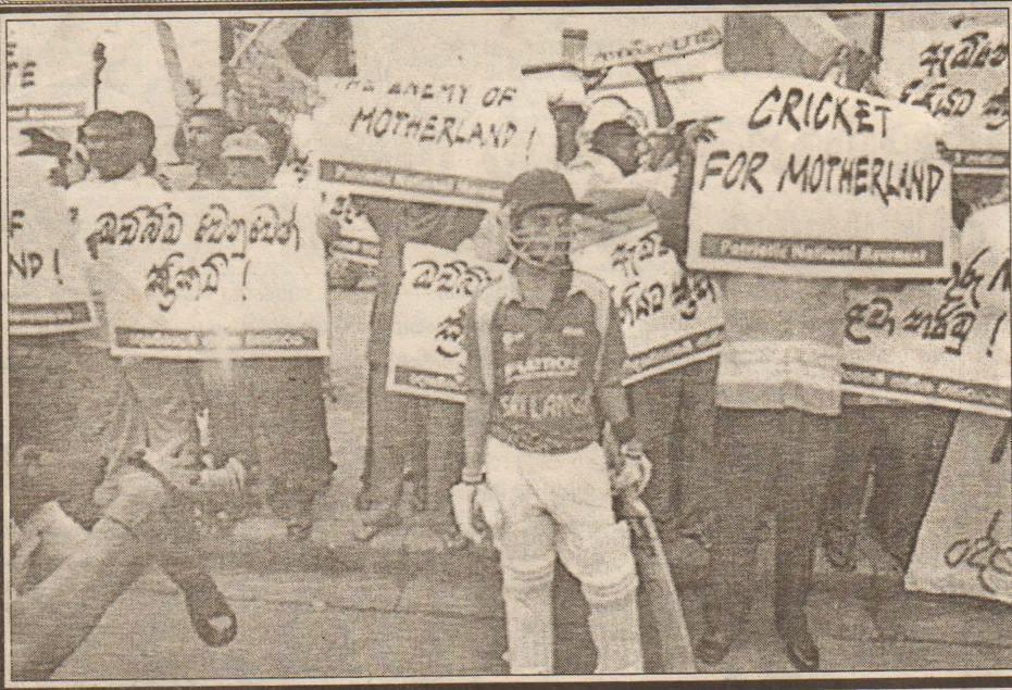
ஆ.வி.பியால் கொழும்பில் நேற்று மேற்கொண்ட எதிர்ப்பு ஆர்ப்பாட்டத்தில் ஈடுபட்டோர்...