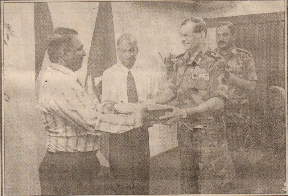
யாழ். குடாநாட்டில் சி.டி.எம்.ஏ. சேவை ஆரம்ப நிகழ்வு நேற்று முற்பகல் 11.30 மணி யளவில் பலாவி இராணுவத்தளத்தில் நடைபெற்றது. இந் நிகழ்வில் யாழ். கட்டளைத்தளபதி மேஜர் ஜெனரல் ஜி.ஏ.சுந்திரசிரி சி.டி.எம்.ஏ. தொலைபேசியை சிறிலங்கா ரெலிக்கொயின் வடமாகாண பிரதிப்பொது முகாமையாளர் வி.போகேந்திரனிடம் கையளிப்பதை படத்தில் காணலாம்.

டித்து முதல் இடத்தில் உள்ளது. சென்னை நகர விநியோக உரிமை மட்டும் 6 1/2 கோடிக்கு விற்கப்பட்ட முதல் திரைப்படம் சிவாஜிதான். சென்னை நகரத்தின் 16 திரையரங்குகளில் திரையிடப்பட்ட முதல் தமிழ்ப்படமும் இதுதான். படம் திரையிடுவதற்கு முன்பே ரிக்கர்ட் முற்பதிவில் மட்டும் ஒரு கோடியே 75 இலட்சத்துக்கு ரிக்கர்ட்டுக்கள் விற்கப்பட்டது இதுவே முதல் முறை. சிவாஜி இந்தியாவில் மட்டும் மட்டும்; வெளி நாடுகளிலும் கொடூரப்பட்ட பறக்கிறது. லண்டனில் ஆங்கிலப் படங்களுக்குப் போட்டியாக யுகே டாப் -10 என்ற பட வரிசையில் இடம் பெற்றிருக்கிறது. இவை அனைத்தும் சாதனை மட்டுமல்ல சரித்திரமும் ஆகும் என அவர் கூறியுள்ளார். (ச-5)