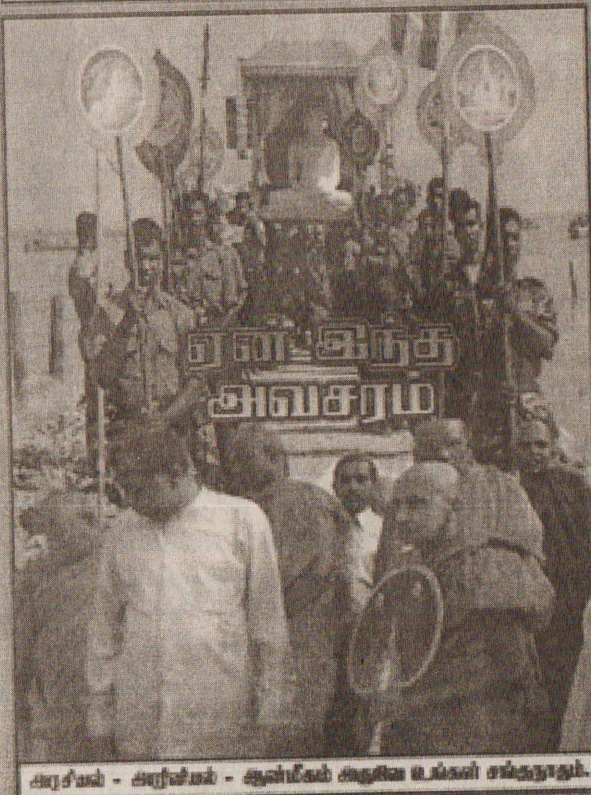
சுருசாவல் - சுருசாவல் - சுருசாவல் சுருசாவல் சுருசாவல் சுருசாவல்.