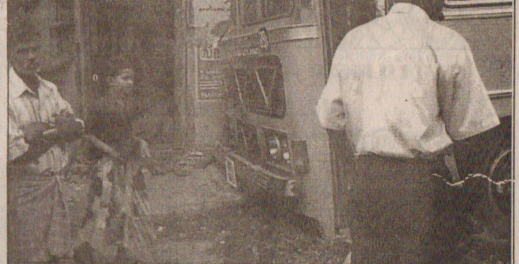
வட பிராந்திய போக்குவரத்துச் சபைக்குச் சொந்தமான பேருந்து ஒன்று, கட்டுப்பாட்டை இழந்து ஓட்டுமடச் சந்திப்புகுதியில் கடை ஒன்றுடன் மோதி விபத்துக்குள்ளான காட்சியைப் படங்களில் காணலாம்.

கொலையாளி சமிந்த ஒரு டய் ரியுடனும் பைகளுடனும் நீதிமன்ற விசாரணையின் போது பொது மக்கள் பார்வையிடும் இடத்தில் அமர்ந்திருந்தார். இச் சம்பவம் வெள்ளிக் (10ஆம் பக்கம் பார்க்க)