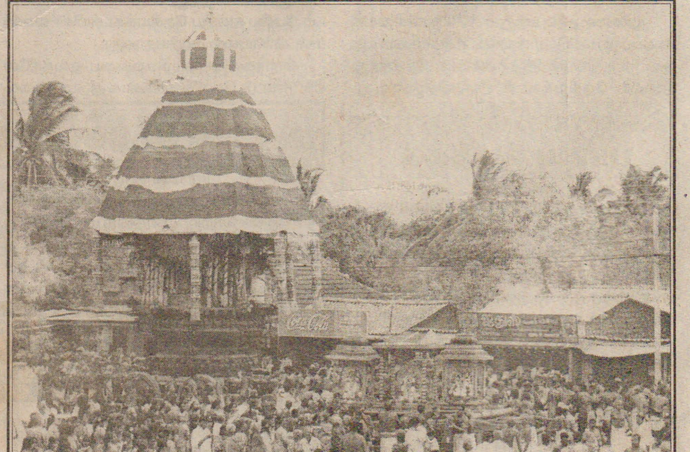
பருத்தித்துறை பசுபதீஸ்வரர் (சிவன் ஆலயம்) பக்த அடியார்கள் சூழ தேரேறி விதிவலம் வரும் காட்சி.