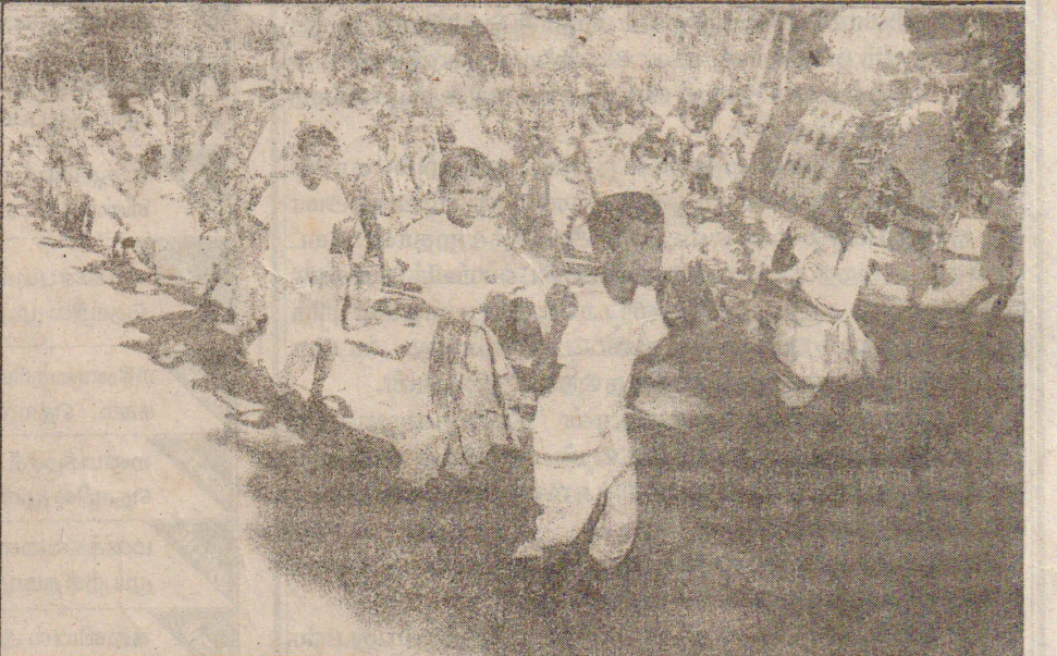
உருமீராய் சைவத்தமிழ் வித்தியாலய தடகவாவிழா நிகழ்வில் முதன்மை நிலை இரண்டு, மாணவர்களின் காவடி நிகழ்வைப் பட்டத்தில் காணலாம்.