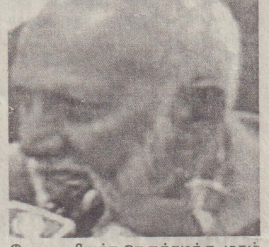
வேலை நிறுத்த நெருக்கடிக்கு முகம் கொடுக்க நேரிடும் என்று தெரிகிறது. ஜனாதிபதியாகச் சந்திரிகா குமாரதுங்க இருந்த போது, பழமறை பெற்றோலியக் கூட்டுத்தாபனப் பாங்குகளை இந்தியப் பெற்றோலியக் கூட்டுத்தாபனத்துக்கு விற்பனை செய்யும் முயற்சிகள் மேற்கொள்ளப்பட்டன.

இதனால் பெற்றோலிய கூட்டுத்தாபனத்தின் ஜே.வி.பி தொழிற்சங்கம் அரசாங்கத்தின் இந்த முடிவுக்கு கடும்த் எதிர்ப்புத் தெரிவித்துள்ளது. முன்னர் தொழிற்சங்கத்தினருடன் ஆலோசனை நடத்திய போதும் பெளசி பெற்றோலியக் கூட்டுத்தாபனம் மேலதிகமாகத் தனியார் மயமாக்கப்படமாட்டாது என்று உறுதியளித்திருந்தார். தற்போது இத்தகைய முடிவை மேற்கொண்டிருப்பதால் இலங்கைப் பெற்றோலியக் கூட்டுத்தாபனம் மீண்டும் ஒரு பாரிய