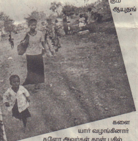
களை யார் வழங்கினார் களோ அவர்கள் தான் பதில்