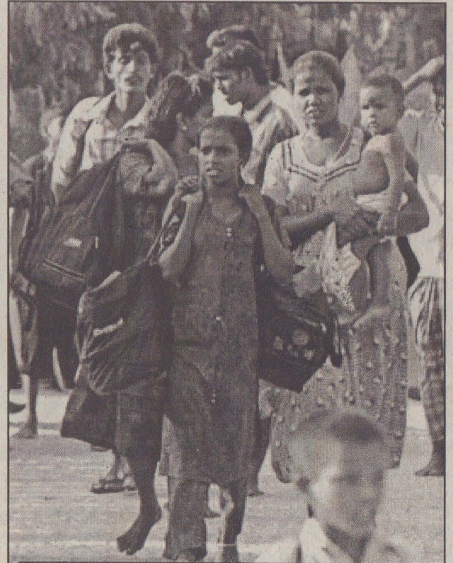
தீவகத்தில் நடத்தப்பட்ட கொலைவெறித் தாக்குதலை அடுத்து பாதுகாப்பான இடங்களை நாடிச்செல்லும் அல்லைப் பிட்டிப் பகுதி மக்கள்!

எம்மீது தாக்குதல் நடத்தப்பட்டால் நாங்கள் உறுதியாக தாக்குதல் நடத்துவோம். எமது படையணிகள் தயார்நிலையிலேயே உள்ளன எனத் தெரிவித்தார்.