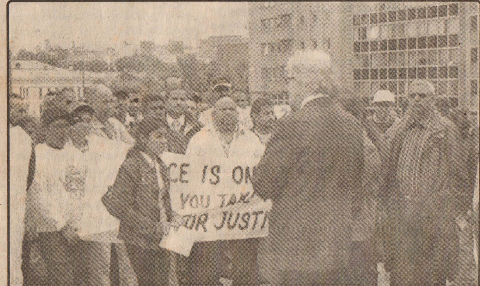
இணைத் தலைமை நாடுகளின் மென்போக்குக்கு எதிராக நோர்வேத் தமிழர்கள் நேற்று மேற்கொண்ட கவனயீர்ப்புப் போராட்டத்தில் கலந்து கொண்ட இலங்கைக்கான விசேட சமாதானத் தூதுவர் ஜோன் ஹான்சன் பெளயர் உரையாற்றுவதை படத்தில் காணலாம்.

அவர்கள் ஐக்கிய தேசியக்கட்சியிலோ அல்லது சுதந்திரக்கட்சியுடன் தான் இணைய வேண்டும். லலித் அணிக்கு நேர்ந்தது என்ன? அரைவாசிப்பேர் ஐக்கிய தேசியக் கட்சிக்குச் சென்றனர். அரைவாசிப்பேர் காலமாகிப் போயினர் என்றார் ஜெயராஜ் பெர்னாண்டோபுள்ளே. (ச-5)