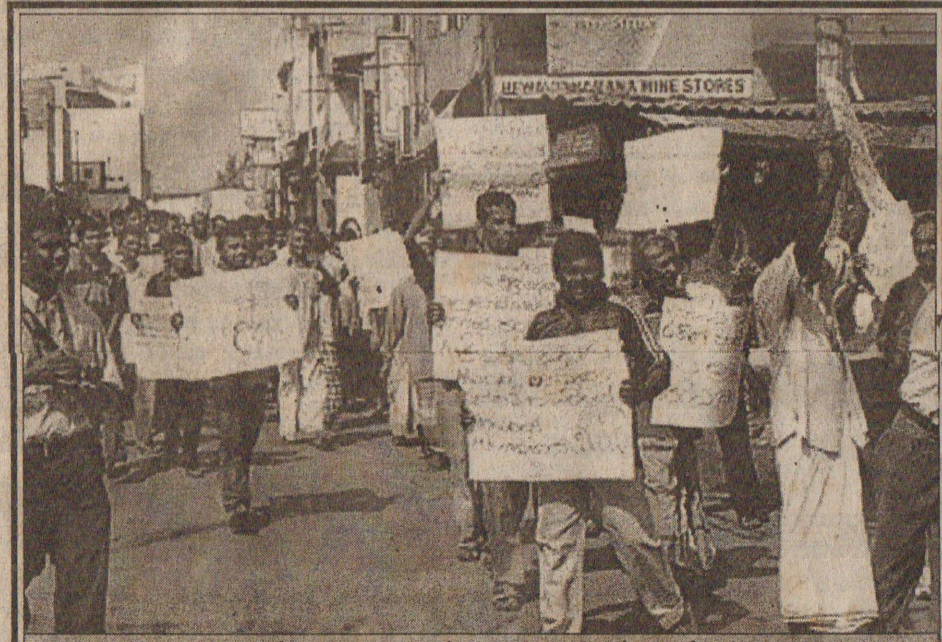
அரச சார் கட்சிகளால் மேற்கொள்ளப்பட்ட பேரணியில் இருந்து...