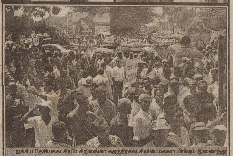
ஐக்கிய தேசியக்கட்சியும் சிறிலங்கா சுதந்திரக்கட்சியின் மக்கள் பிரிவும் இணைந்து நடத்திய பேரணியில் இருந்து...