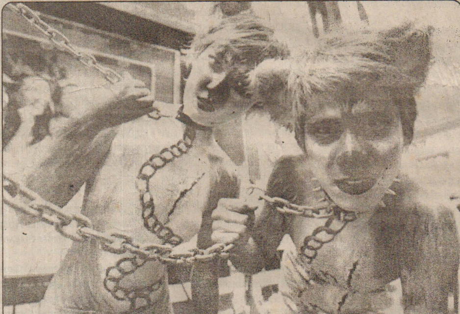
தென்கொரியாவில் விலங்குகள் கொல்லப்படுவதற்கு எதிராக விலங்குகளை போல வேடமணிந்து போராடுகிறார்கள் இவர்கள்.

ஒரு கிலோவுக்கு தரத்துக்கு ஏற்றவாறு 300 முதல் ரூபா 8 ஆயிரம் வரை கிடைக்கும். எனவே பல ஆயிரம் ஏக்கரில் ஸ்டெவியா செடியை பயிரி செய்யும் பணியில் பராகுவே நாடு தீயிட்டுள்ளது. சீனாவிலும் ஸ்டெவியா செடி பயிரி செய்யப்பட்டு வந்தாலும் பராகுவே நாட்டில் தான் அதற்கான சூழ்நிலை காணப்படுகிறது. சீனாவை விட மூன்று மடங்கு அளவில் பராகுவேயில் இந்த செடி வளரும். எனவே பராகுவே நாட்டு மக்களின் ஏழ்மையை போக்கு பசுமை தங்கமாக ஸ்டெவியா மூலிகைச் செடி கருதப்படுகிறது. (அ-5)