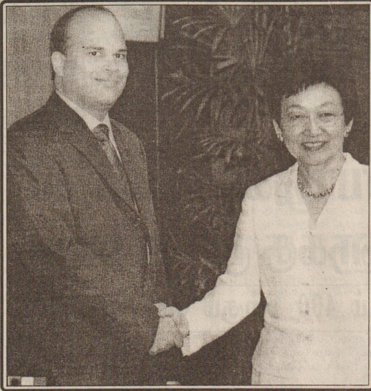
ஐப்பானிய வெளிவகார அமைச்சர் யொற்கோ கவாகுச்சியுடன், அமைச்சர் மிலந்த மொறகொட.

ஆனால், இப்போதுள்ள நிலவரங்களின்படி, யுத்தத்தைப் பற்றிக் கதைப்பது என்பது சில அதிர்விரவாதிகளின் விருப்பத்தையோ அல்லது விரக்திவசப்பட்டோரின் விருப்ப