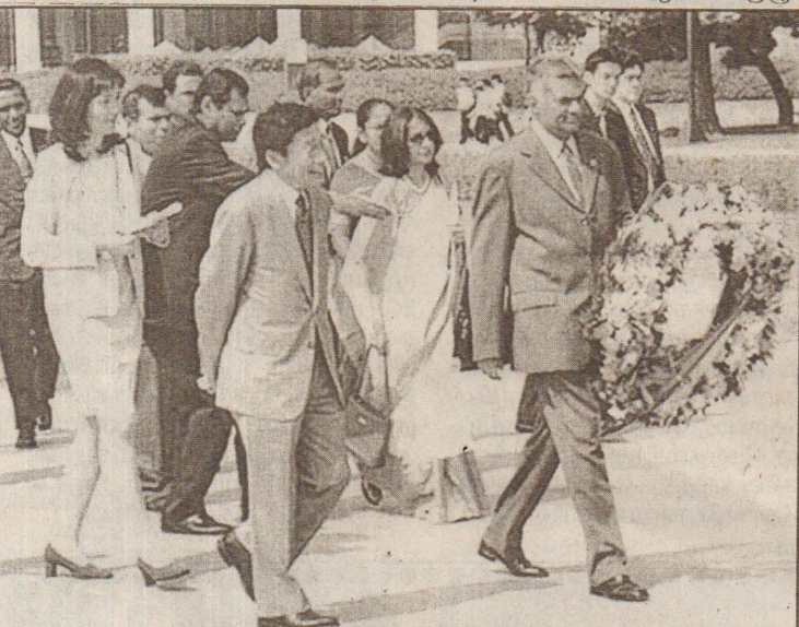
ஜப்பான், ஹிரோஷிமாவில் - யுத்தவீரர்கள் நினைவுப் பூங்காவுக்கு மலர்வளையம் வைத்து அஞ்சலி செலுத்தச் செல்கிறார் பிரதமர் ரணில்.