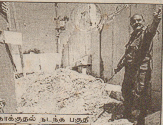
தாக்குதல் நடந்த பகுதி அமெரிக்க அதிபர் ஜேர்ஜ் டபிள்யூ புஷ் - தனது புதிய சமாதானத் திட்டத்தை முன்னெடுத்து வருகையில், காஸாப் பகுதியில் இஸ்ரேலியர்களின் முக்கிய கடவைப் பகுதியொன்றில் நடைபெற்ற கடுமையான

சண்டையொன்றில் - நான்கு இஸ்ரேலியப் படைமீனரும், மூன்று பலஸ்தீனர்களும் பலியாகியிருக்கின்றனர்.