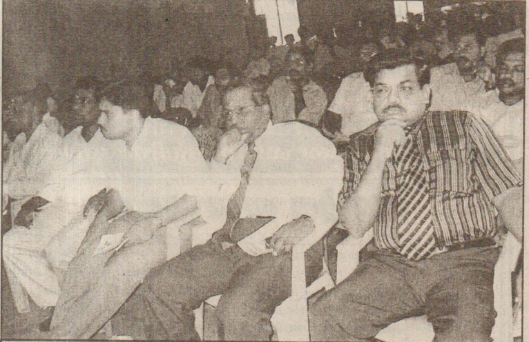
யாழ் வீரசிங்கம் மண்டபத்தில் நேற்று முன்தினம் கிடம் பெற்ற சிறுவர் செயற்பாட்டுக்கான அமைப்பு நிகழ்வில் கலந்து கொண்ட பிரமுகர்களைப் படத்தில் காணலாம்.