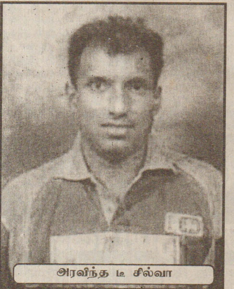
அரவிந்த டி சில்வா

மக்களிடம் செல்லும் அரசியல்வாதிகள்தான், உறுதிமொழிகளைக் காற்றில் பறக்கவிடுவார்கள். கிரிக்கெட் சபைத் தேர்தலில் போட்டியிடுபவர்கள்கூட, வாக்குறுதிகளைப் பறக்கவிடுகின்றார்கள். ஏன்? கிரிக்கெட்