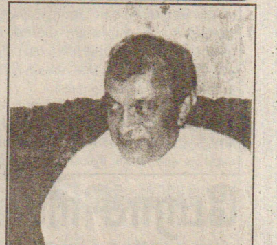
தகவல் அமைச்சர் கரு ஜெயசூரிய மேலும் தெரிவித்தார்.

தீவகத்தில் மிகக் குறைந்தளவு மக்களே மின்சார வசதிகளைப் பெற்றுக் கொண்டிருக்கின்றனர். விரைவில் அனைத்துத் தீவுகளிலும் மின்சார வசதிகளைப் பெற்றுக் கொடுப்பதற்கான நடவடிக்கைகளில், மின்சார சபை அதிகாரிகள் ஈடுபடவுள்ள