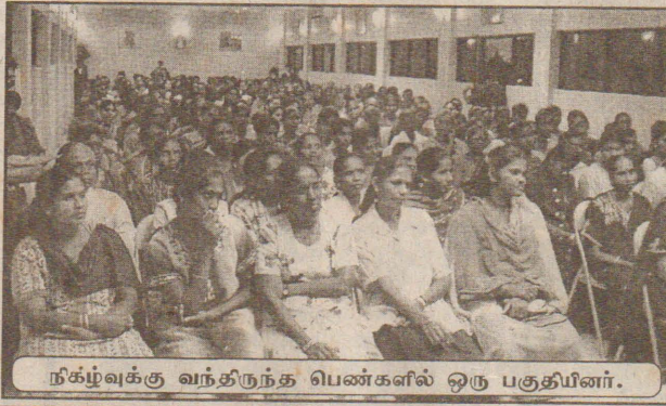
நீகழ்வுக்கு வந்திருந்த பெண்களில் ஒரு பகுதியினர்.

விடுதலைப் புலிகளின் கிழக்குப் பிராந்தியத் தளபதி கேணல் கருணா